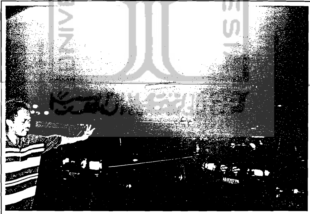
Mandala Bhakti Wanitatama Parkir pengunjung yang melebar ke bahu jalan, secara otomatis menimbulkan kemacetan lalu lintas