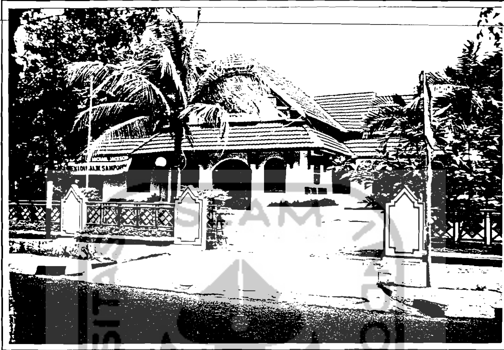
Gedung Bentara Budaya Gedung yang kurang representatif, baik dari segi penempatan maupun penampilan bangunan