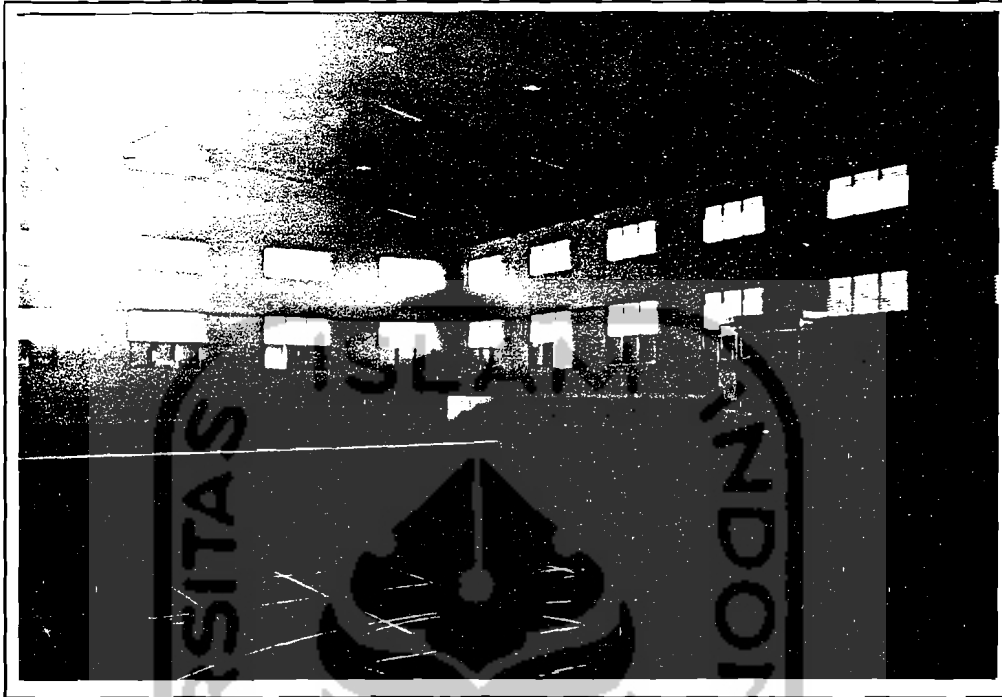
Sport Hall Kridosono

Sarana dan prasarana pada gedung ini kurang mendukung kegiatan yang sering diselenggarakan. Karena memang dari awal perencanaan tidak diarahkan sebagai gedung serbaguna.