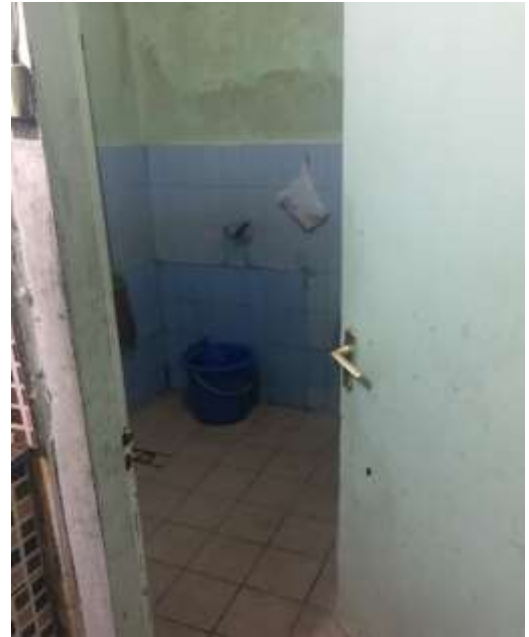
Kondisi Toilet Warmino