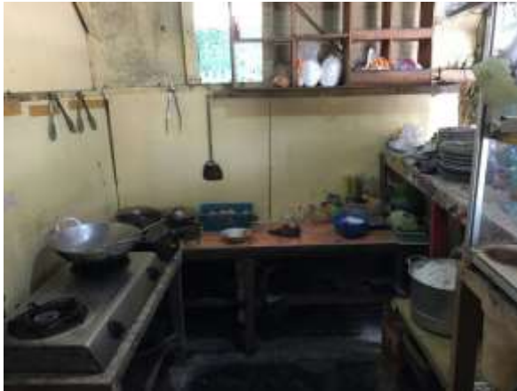
Kondisi Dapur Warmino