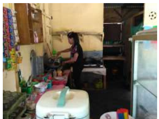
Pengolahan bahan baku