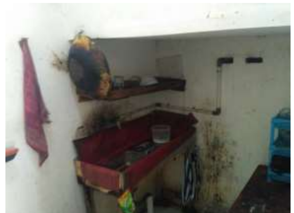
Tempat pencucian peralatan