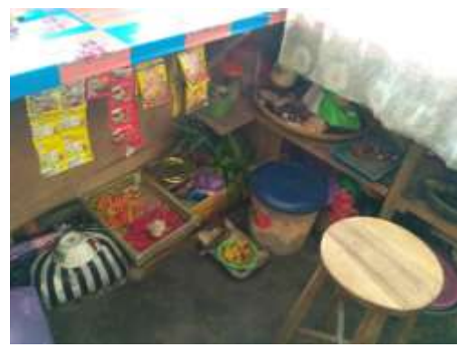
Penyimpanan bahan baku