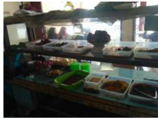
Penyimpanan makanan jadi