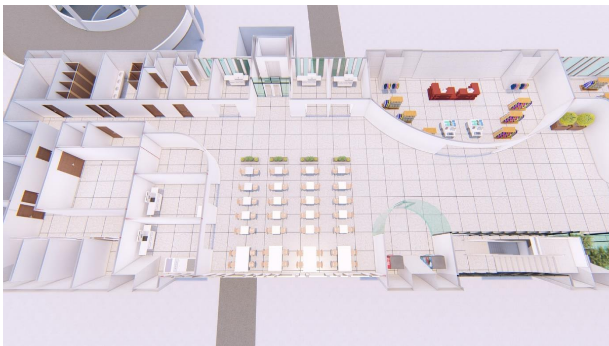
Gambar 5. 2 Shopping Rent B