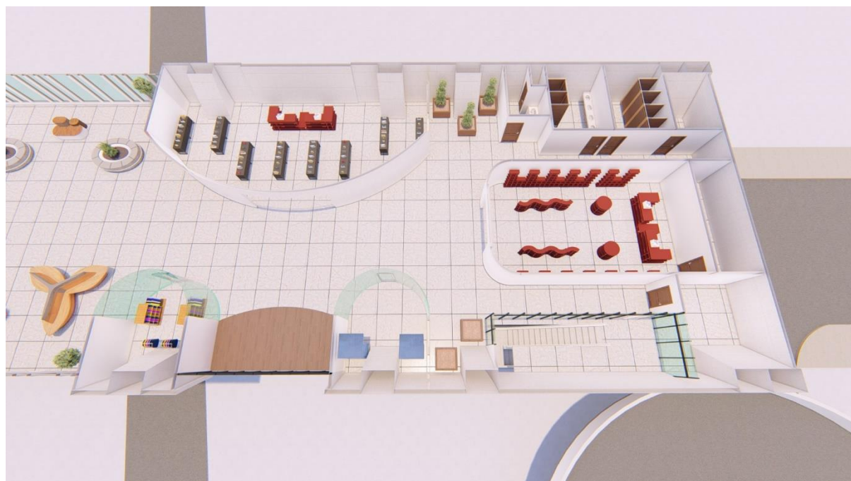
Gambar 5. 3 Shopping Rent C