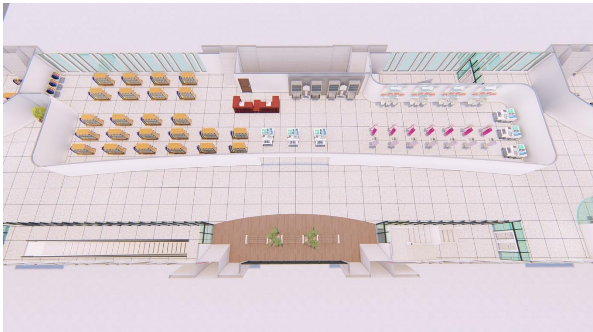
Gambar 5. 1 Shopping rent A