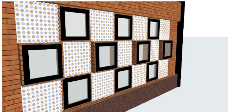
Gambar 6.1: Dinding Botol Kaca

Salah satu responden menyarankan pengaplikasian botol kaca ditata secara berwarna-warni.