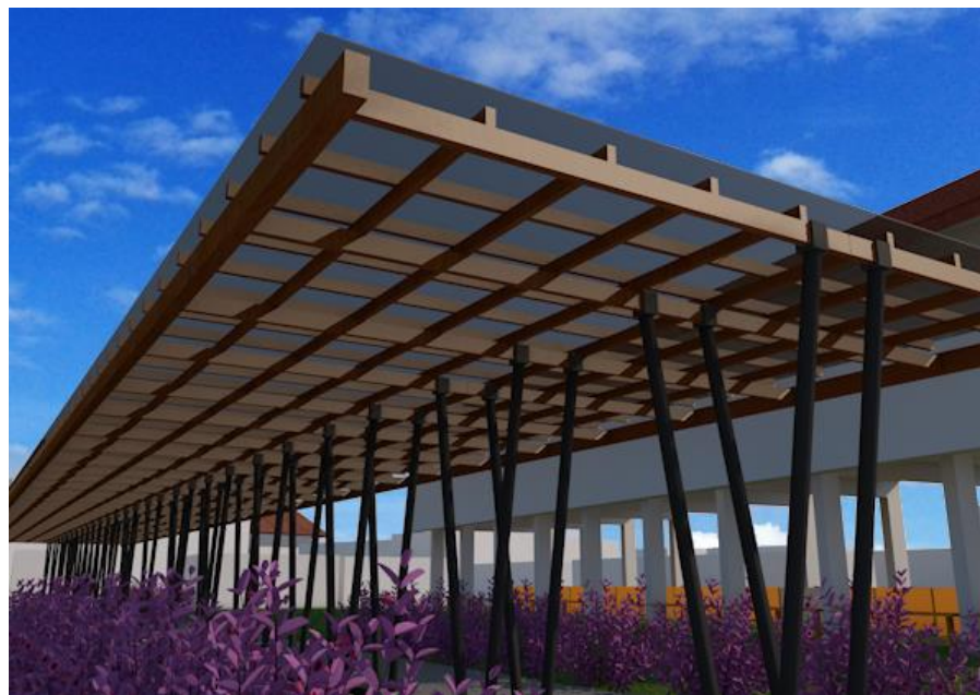
Gambar 6.4: Naungan Lahan Parkir