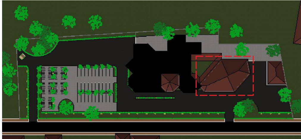
Gambar 6.5: Atap Ruang Produksi