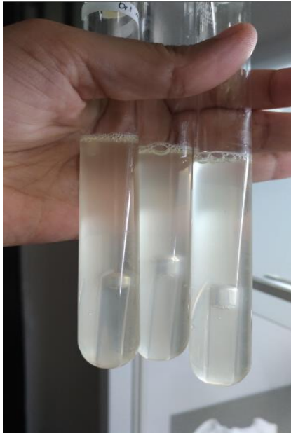
Tabung positif pada uji pendugaan