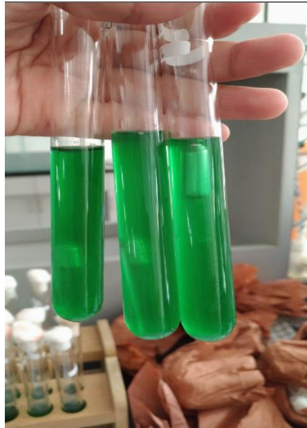
Tabung positif pada uji penegasan