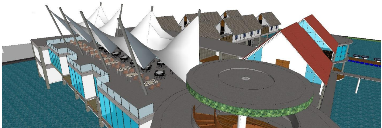
Gambar 87. Desain Baru Atap Café Outdoor

Gambar diatas merupakan desain bentuk pada atap “café outdoor” setelah dievaluasi, bentuk atap terinspirasi oleh gulungan ombak laut dan layar kapal nelayan menggambarkan kehidupan yang berada di pesisir laut dan didominasi oleh kehidupan nelayan, struktur yang digunakan ialah rangka baja moveable dengan profil “O” dan penutup menggunakan material membrane agar dapat moveable dan dapat dibuka tutup sesuai kebutuhan serta mudah dalam pelaksanaan.