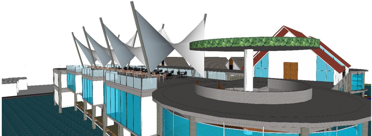
Gambar 86. Desain Baru Atap Café Outdoor