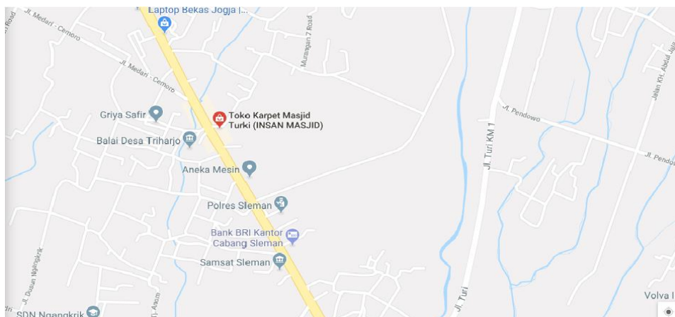
Peta Lokasi Magang