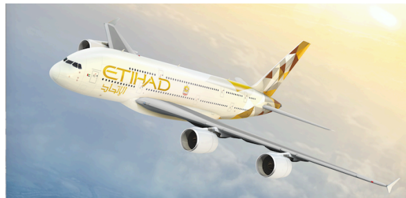
Gambar 3.4 Livery Etihad

Livery ini tidak hanya berfungsi sebagai alat promosi acara internasional, tetapi juga sebagai representasi visual UEA sebagai negara tuan rumah Expo 2020 yang modern, inovatif, dan terbuka. Dengan mengoperasikan pesawat ber livery Expo 2020 ke berbagai destinasi global, Emirates secara efektif membawa pesan diplomasi publik UEA melampaui batas geografis negara, menjadikan pesawat sebagai media diplomasi bergerak yang membawa representasi negara ke berbagai ruang internasional. (Listianto 2024).