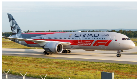
Gambar 3.5 Livery Abu Dhabi Grand Prix Etihad Airways

Pilihan warna, bentuk geometris teratur, dan komposisi visual yang rapi ini menghasilkan tampilan pesawat yang konsisten, mudah dikenali, dan berbeda dari maskapai lain, sehingga berfungsi sebagai identitas visual UEA yang tampil dalam setiap interaksi pesawat Etihad di bandara internasional. Representasi visual yang konsisten dan mudah dikenali berperan penting dalam membangun nation branding , terutama ketika disampaikan melalui institusi yang berinteraksi langsung dengan publik internasional (Rabe, n.d.).