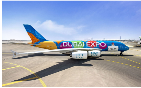
Gambar 3.3 Livery Dubai Expo Emirates