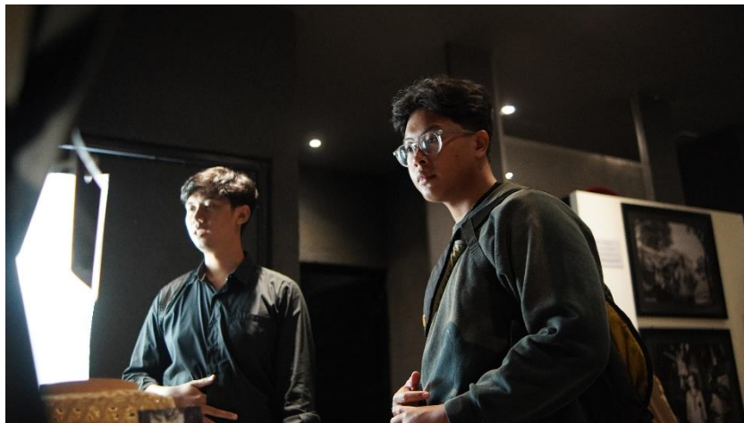
Gambar 2. 13 dokumentasi Pameran Day 2