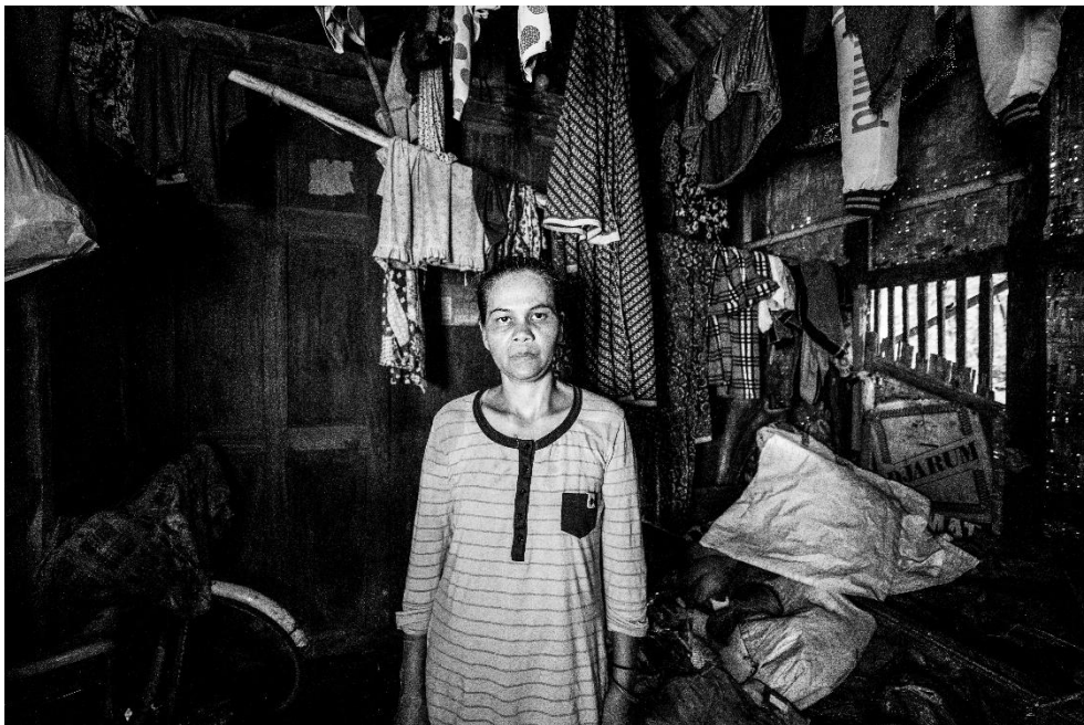
Karya 1. "nasib yang redup"