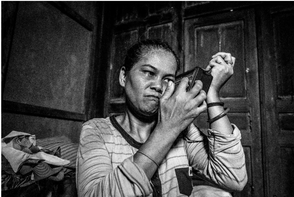
Karya 3. "kebahagiaan yang tertunda"