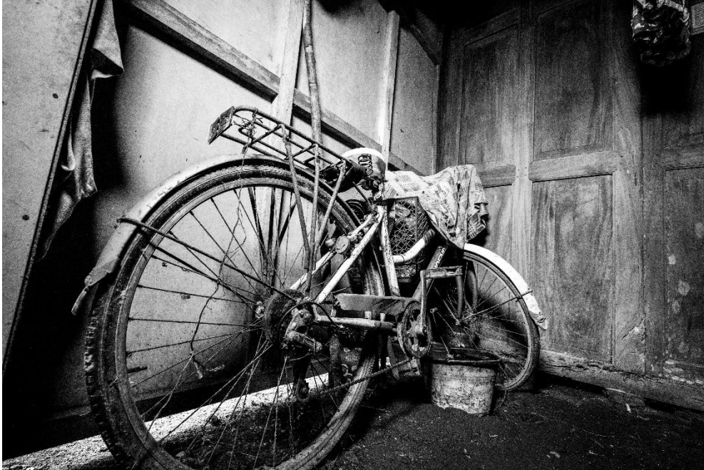
Karya 11. "kenangan yang tersandar diam"