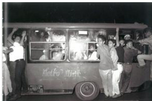
Gambar 2.6 karya “fotografi jalanan: membingkai kota dalam cerita”

Dalam bukunya Jakarta: Banal estetika, fotografer Erik Prasetya menggunakan fotografi jalanan untuk merepresentasikan Jakarta secara visual. Berisi temuan fotografi selama 20 tahun yang bercerita tentang Jakarta. Istilah "fotografi jalanan" mengacu pada jenis fotografi yang tidak hanya mencakup peristiwa yang terjadi di jalanan nyata atau jalan dengan struktur yang terbuat dari aspal atau beton, tetapi juga perjalanan hidup yang dilihat dari berbagai sudut pandang. Perkembangan suatu masyarakat terjadi di samping jalan raya, baik di gang besar, kecil, maupun berkelok-kelok. Untuk menangkap narasi yang menarik di kamera, fotografer jalanan harus memiliki pemahaman menyeluruh tentang subjeknya dan mengetahui kapan dan di mana harus mendekatinya.