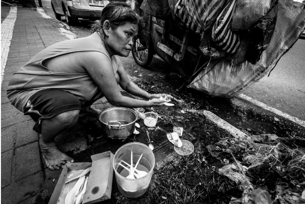
Karya 4. "di antara sisa dan harapan"