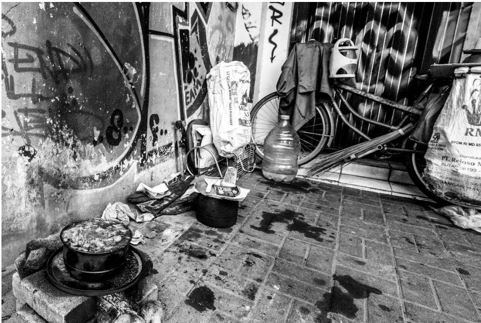
Karya 7. "antara bertahan dan dilupakan"