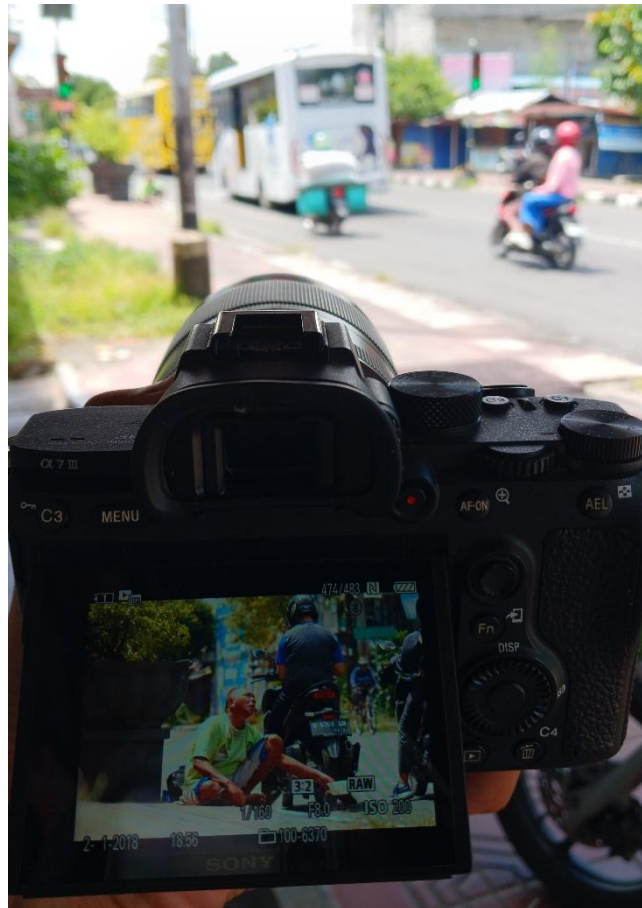
Gambar 2. 4 survei beserta potret kemiskinan kota yogyakarta

mengambil gambar, tetapi juga soal membangun koneksi emosional, menghormati subjek, dan menyampaikan kisah mereka dengan jujur dan bermartabat.