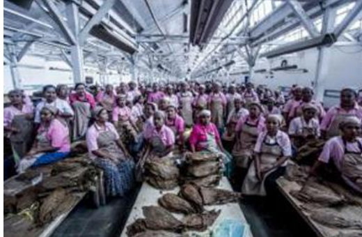
Gambar 1.5 karya “fotografi jalanan: membingkai kota dalam cerita”.

menghadapi hambatan dalam perizinan dan bahasa, pendekatan yang persuasif dan intensif berhasil membangun kepercayaan, sehingga karya yang dihasilkan mampu menyampaikan pesan sosial dan emosional secara kuat kepada audiens.