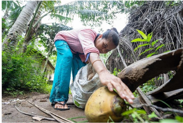
Gambar 2. 6 potret kemiskinan pedesaan yogyakarta