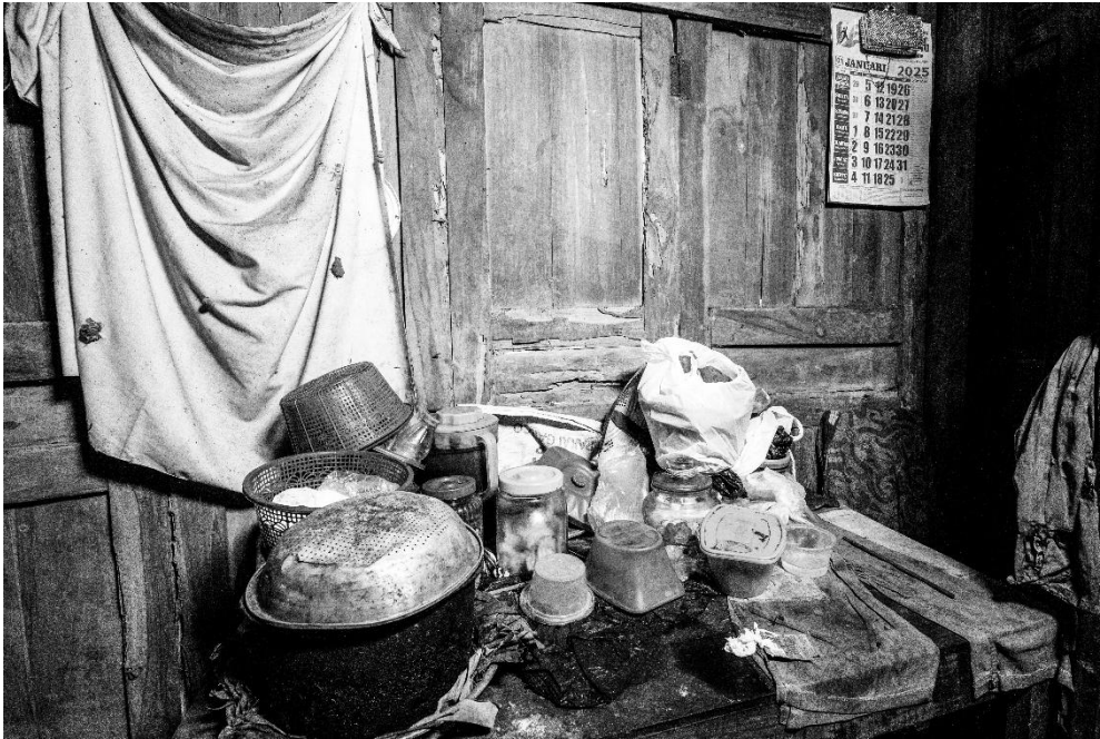
Karya 10. "cukup tak seindah yang dibayangkan"