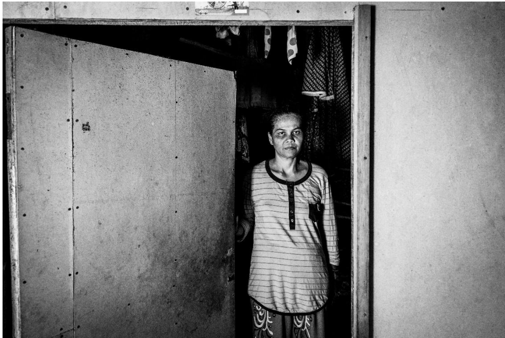
Karya 8. "dinding tipis, harapan yang kuat"