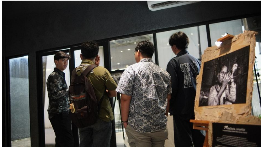
Gambar 2. 12 dokumentasi Pameran Day 1