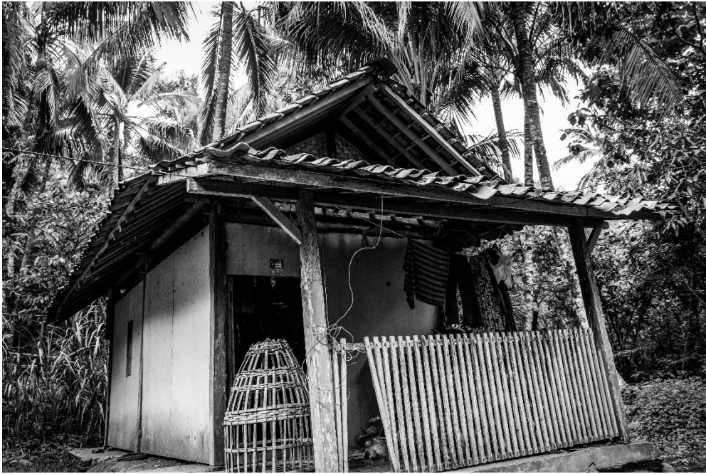
Karya 12. "dia yang berdiri tanpa belas kasih"