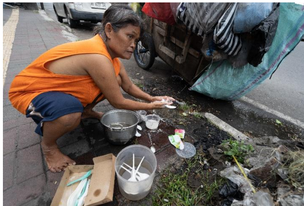
Gambar 2. 7 potret kemiskinan perkotaan kota yogyakarta