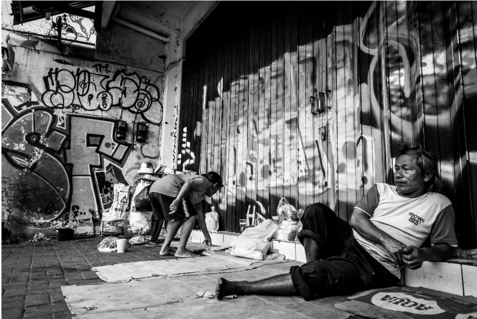
Karya 6. "tempat berteduh bukan rumah"