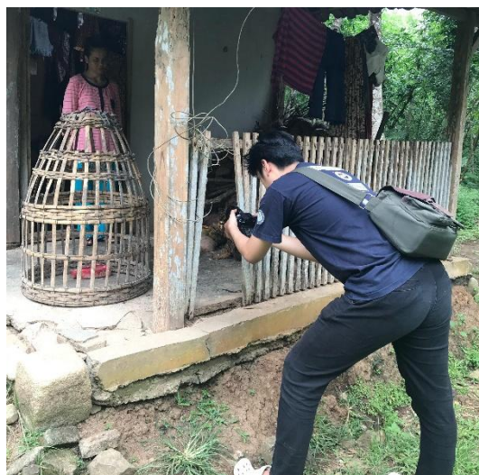
Gambar 2. 5 pemotretan kemiskinan desa

Pemotretan berlangsung selama satu hari penuh, dengan memanfaatkan pencahayaan alami dan dibantu dengan portable lighting untuk mengambil gambar di lokasi-lokasi yang mencerminkan kondisi hidup subjek, seperti rumah sederhana, dan juga fasilitas seadanya yang bisa digunakan. Dengan komposisi yang mempertimbangkan konteks dan narasi visual, foto-foto yang dihasilkan mampu mempresentasikan isu kemiskinan secara manusiawi tanpa kehilangan makna empati.