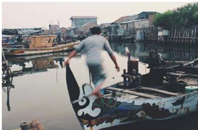
Gambar 1. 2 karya "perancangan fotografi human interest kampung nelayan tambak lorok semarang"