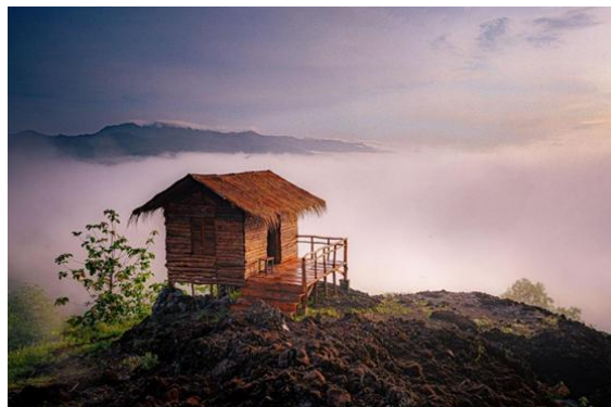
Gambar 1. 4 karya "potret pesona hidden gems indonesia dalam fotografi landscape di yogyakarta tahun 2023"

Fathur Hidayanto (2023) karya penciptaan karya ini untuk menyampaikan keindahan hidden gems di Yogyakarta. Keindahan dari pembuatan karya ini adalah akan meningkatkan kesadaran pemirsa akan destinasi wisata baru dan terpencil dengan tetap menjaga keindahannya dan menawarkan pemandangan Yogyakarta yang menakjubkan, memberikan pemirsa destinasi baru sebagai inspirasi saat merencanakan liburan berikutnya. Dalam hal fotografi merupakan sarana komunikasi visual yang dapat menyampaikan pesan dengan baik, baik pesan sederhana hingga pesan penting, seperti terlihat pada karya yang telah dihasilkan. Karya yang telah dihasilkan peneliti memiliki peluang besar untuk dijadikan sarana promosi wisata daerah Yogyakarta.