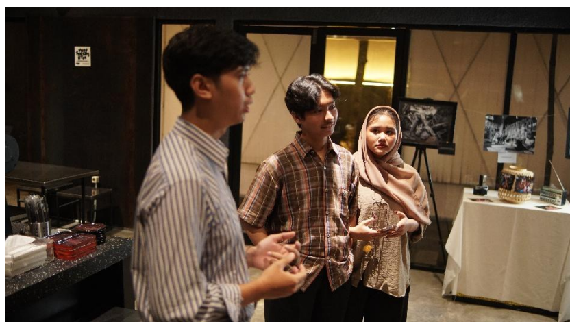
Gambar 2. 14 dokumentasi Pameran Day 3