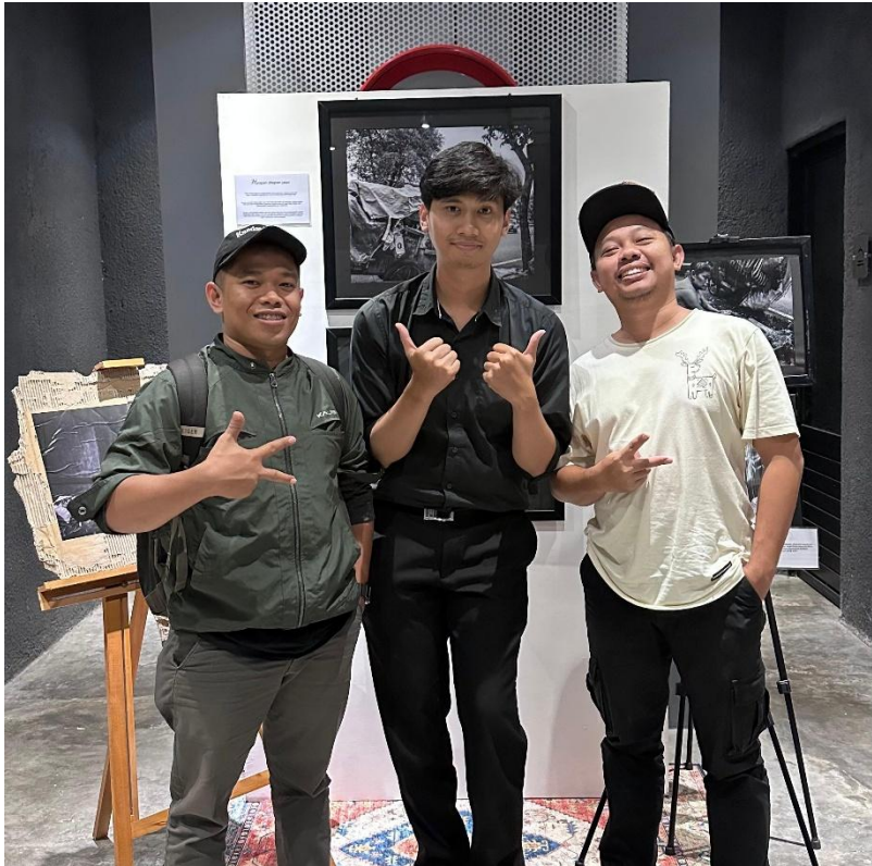
Gambar 2. 15 dokumentasi Bersama dosen pembimbing dan staf akademik Ilmu Komunikasi UII