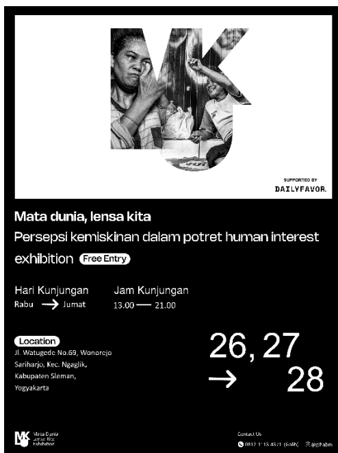
Gambar 2. 10 poster mata dunia, lensa Kita