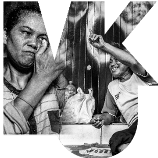
Persepsi Dalam potret Human Interest