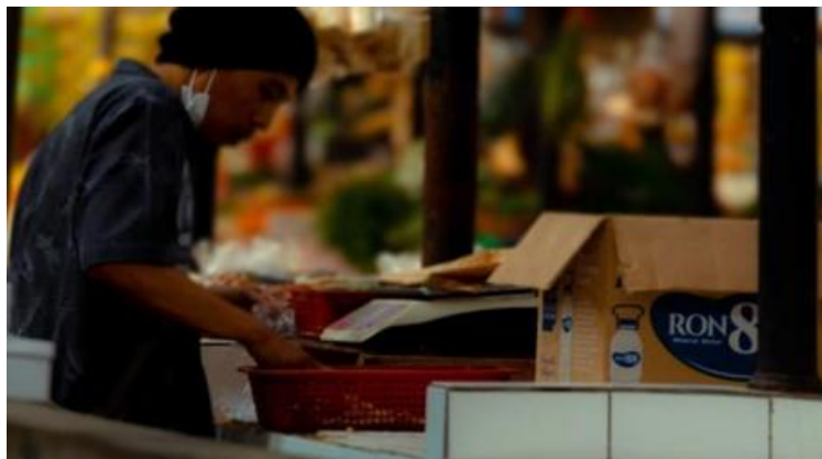
Gambar 1. 3 karya "Pembuatan Karya Life Interest photo dengan menggunakan teknik animated photo "

Karya fotografi oleh Fikri Nabil Hibatullah, Soni Sadono, dan Teddy Ageng Maulana membawakan karya seni fotografi human interest . Penciptaan karya ini berhasil menggabungkan genre fotografi human interest dengan teknik animated photo menggunakan efek parallax , demi menciptakan karya foto yang lebih hidup dan juga komunikatif secara visual . Teknik ini dinilai mampu memperkuat pesan emosional dalam foto serta menjawab tren konsumsi visual masyarakat yang kini lebih tertarik pada konten video pendek. Selain menghasilkan karya yang inovatif, penulis juga memperoleh wawasan baru dalam hal teknis pengeditan serta pemahaman sosial terhadap kehidupan masyarakat kelas bawah di tengah kota. Meskipun begitu, penulis menyadari masih ada kekurangan dalam aspek pencahayaan pada beberapa karya.