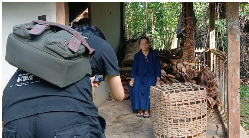
Gambar 2. 2pemotretan awal survei serta penetapan konsep fotografi di desa hargomulyo, kulon progo

Setelah mengumpulkan sebagian data, fotografer dapat mengidentifikasi sejumlah lokasi yang akan dilanjutkan ke tahap berikutnya, yang melibatkan survei area dan pengambilan foto awal untuk menentukan lokasi pasti objek. Setelah Pengusungan konsep sudah dikatakan matang selanjutnya fotografer menetapkan lokasi yang akan dijadikan pemotretan, dari berbagai sumber referensi seperti dari BPS Yogyakarta fotografer melakukan sebuah survei di daerah kota Yogyakarta untuk daerah perkotaan, dan daerah Kulon progo sebagai daerah pedesaan. Keduanya memiliki jarak tempuh yang bervariasi, seperti kota sleman tepatnya di jalan kolonel sugiono memiliki jarak tempuh sekitar 43 menit dari tempat fotografer yakni Universitas Islam Indonesia.