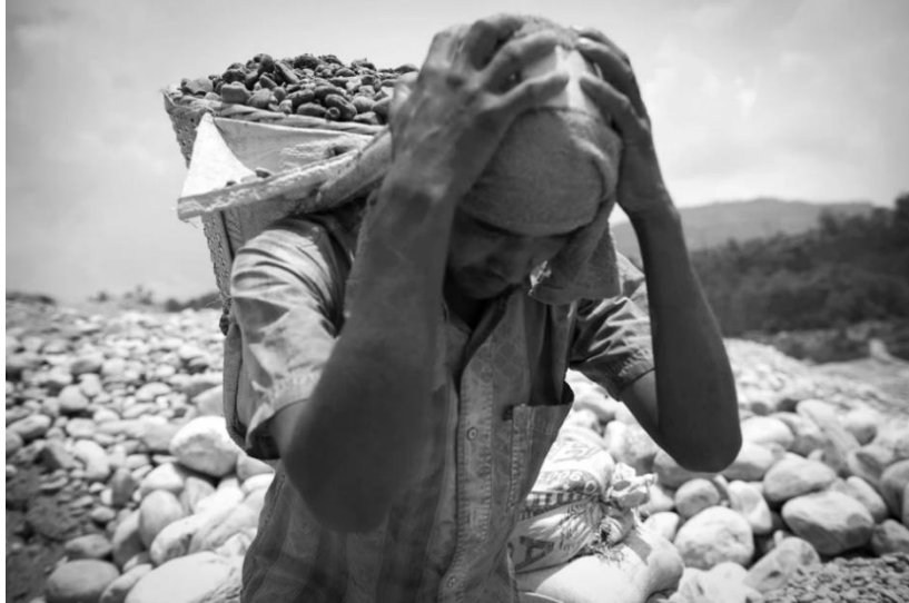
Gambar 2. 1 observasi foto melalui platform behance

Pada tahap ini fotografer melakukan sebuah riset terdahulu melalui berbagai macam media sosial seperti pinterest , behance , instagram , dan google untuk mendapatkan informasi terkait dengan fotografi human interest , beserta lokasi terkait dengan kemiskinan yang ada di Yogyakarta. Fotografer melakukan riset pada bulan september 2024 hingga oktober 2024. Untuk mendapatkan hasil terbaik, tugas akhir ini dilakukan selama satu bulan penuh. Untuk mempelajari lebih spesifik tentang kemiskinan pada lokasi tersebut, fotografer kemudian melakukan pencarian di google maps , dengan tujuan agar mendapatkan rincian dari jarak yang akan ditempuh dari lokasi fotografer ke subjek.