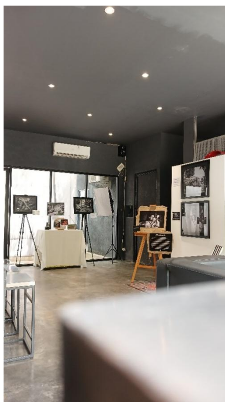
Gambar 2. 11 design Pameran