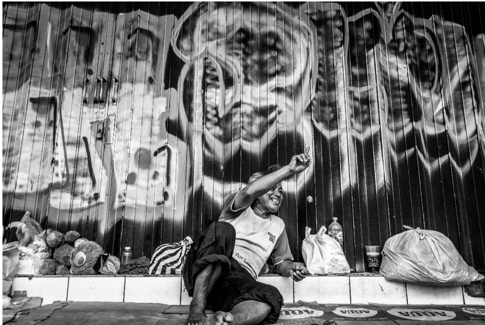
Karya 5 "yang terlihat tak selalu seutuhnya"