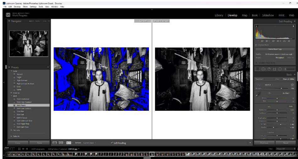
Gambar 2. 8 screenshot proses editing adobe lightroom classic cc

Setelah selesai tahap editing, fotografer melakukan konsultasi dengan dosen pembimbing mengenai hasil editing. Pada tahapan editing fotografer menggunakan teori dalam pewarnaan foto hitam putih yakni teori Ansel Adams. Teori ini biasa disebut dengan “zone system”, sebuah pendekatan teknis dan artistik untuk mengelola eksposur dan pencahayaan dalam fotografi hitam putih. Tujuannya menggunakan teori ini untuk membantu fotografer dalam menciptakan karya yang tepat secara teknis dan sesuai dengan artistik serta mengontrol rentang tonal (gelap-terang) dalam foto. Setelah tahap editing, karya foto yang final disetujui selanjutnya fotografer mengembangkan mengenai konsep tahapan pameran.