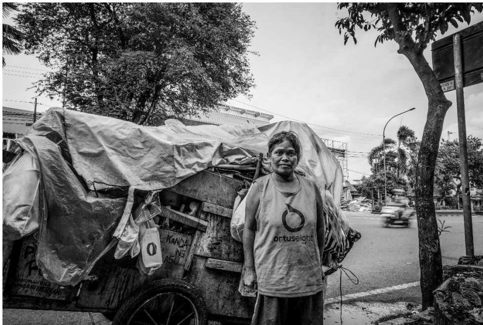
Karya 2. "harapan ditepian jalan"