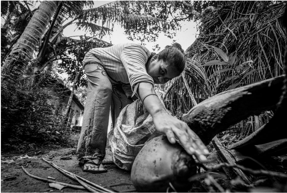
Karya 9. "teguh dalam keterbatasan"