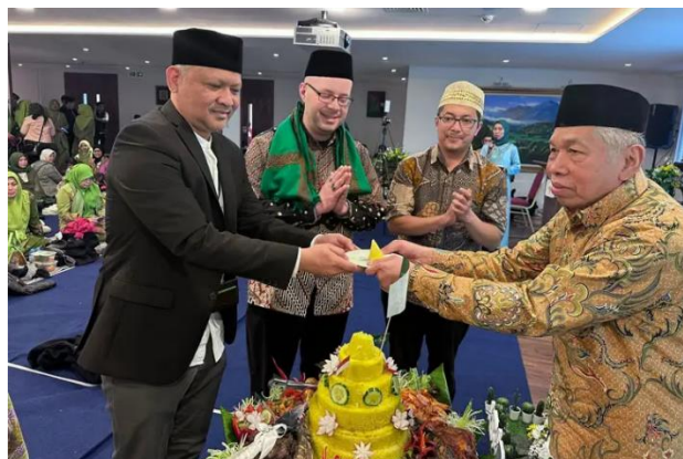
Gambar 2. Peringatan Satu Abad Nahdlatul Ulama oleh komunitas Nahdliyin diaspora di London.