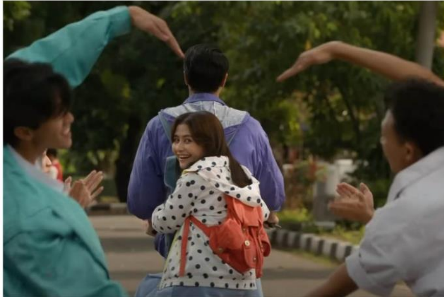
Gambar 2. 3 Salah Satu Adegan Gita Cinta Dari SMA (2023)