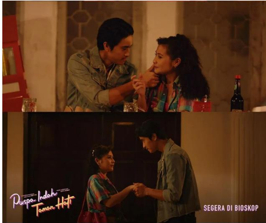
Gambar 2. 4 Salah Satu Adegan Puspa Indah Taman Hati (2023)