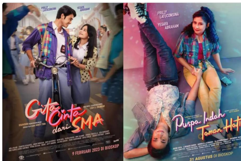
Gambar 2. 2 Poster Film Gita Cinta Dari SMA & Puspa Indah Taman Hati (2023)

Sementara itu, film Puspa Indah Taman Hati yang dirilis pada tahun 2023 juga digarap oleh Monty Tiwa sebagai bentuk lanjutan ( spin-off ) dari kisah klasik Galih dan Ratna. Jika film Gita Cinta dari SMA menyoroti fase remaja, maka Puspa Indah Taman Hati menggambarkan kehidupan mereka setelah dewasa, ketika cinta harus diuji oleh realitas karier, ego pribadi, dan perubahan zaman. Film ini merefleksikan bagaimana romantisme yang ideal di masa remaja berhadapan dengan kompromi dalam kehidupan nyata, sehingga memperluas cakupan narasi cinta Galih dan Ratna bagi audiens modern.