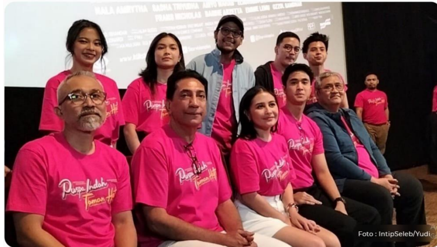
Gambar 2. 1 Sutradara dan Pemeran Film Gita Cinta dari SMA & Puspa Indah Taman Hati (2023)

dengan gaya sinematografi modern dan konteks kehidupan remaja kontemporer. Representasi cinta remaja dalam versi baru tetap berfokus pada tema universal tentang perjuangan cinta, tetapi dibalut dengan nuansa yang lebih sesuai dengan selera audiens masa kini.