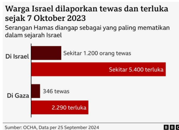
Diagram 2. Data Korban Jiwa Konflik Israel-Palestina pada 7 Oktober 2023