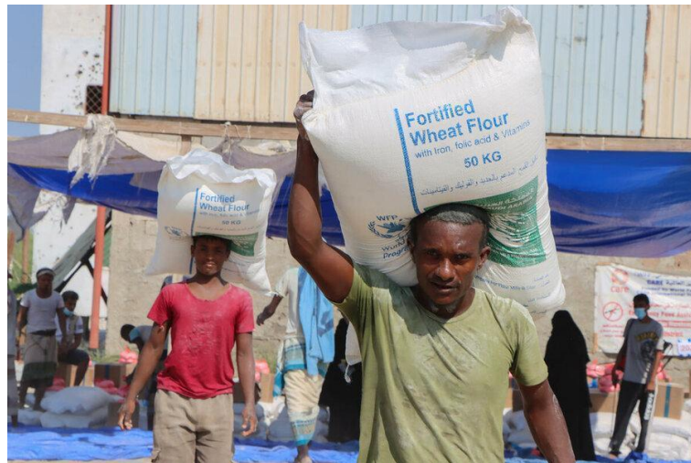
Gambar 5. Pembagian Makanan Darurat di Zinjibar, Provinsi Abyan Tahun 2021