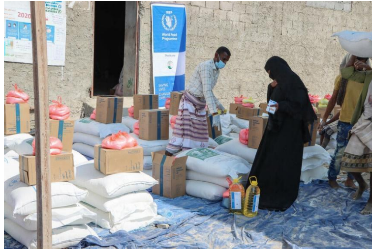
Gambar 4. Titik Distribusi Bantuan WFP di Zinjibar, Provinsi Abyan