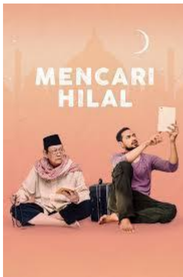
Gambar 2.1 - Poster film Mencari Hilal (2015)