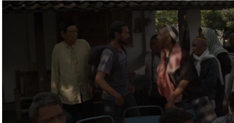
Gambar 3.5 – Adegan Heli Bentrok dengan Ormas