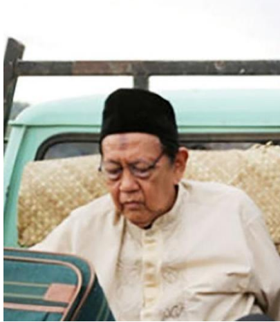
Gambar 2.2 - Tokoh Mahmud