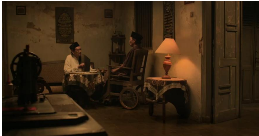
Gambar 3.3 - Adegan Diskusi Pandangan Cara Mencari Hilal