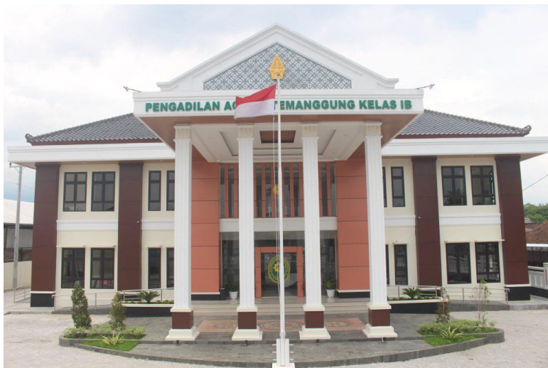
Gambar 1 Kantor Pengadilan Agama Temanggung.

Wilayah hukum atau yurisdiksi Pengadilan Agama Temanggung sama dengan wilayah Kabupaten Temanggung, yang mempunyai wilayah seluas 870,25 kilometer persegi dengan terdiri dari 20 (dua puluh) kecamatan dan 289 (dua ratus delapan puluh sembilan) kelurahan/desa. 54