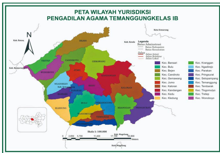
Gambar 2 Peta Wilayah Yurisdiksi Pengadilan Agama Temanggung. sumber: pa-temanggung.go.id

Untuk mewujudkan peradilan yang professional, mandiri, transparan dan modern, yang mampu memberikan pelayanan publik yang prima kepada masyarakat pencari keadilan secara cepat, sederhana dan biaya ringan, serta sejalan dengan visi dan misi Mahkamah Agung, maka dirumuskan visi Pengadilan Agama Temanggung, yakni : 55