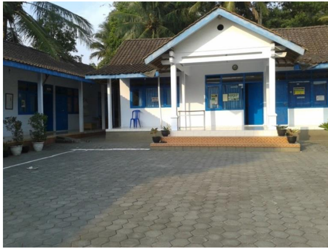
Gambar 2.1 Gedung pengasuhan dan aula

Gedung tersebut digunakan untuk kegiatan-kegiatan seperti tempat untuk belajar mengajar dan sebagai tempat tinggal pengasuh proses administrasi anak-anak asuh juga dilakukan di gedung tersebut.