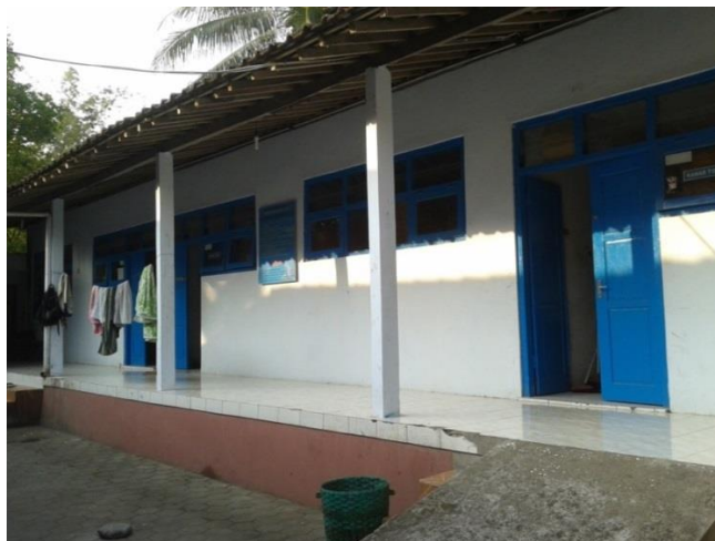
Gambar 2.2 Gedung tempat untuk tidur

Gedung tersebut digunakan untuk kegiatan-kegiatan seperti tempat untuk belajar mengajar dan sebagai tempat tinggal pengasuh proses administrasi anak-anak asuh juga dilakukan di gedung tersebut.