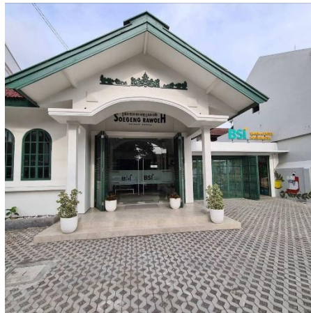
Gambar 1 BSI UMKM Center Yogyakarta