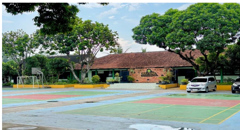
Gambar 3 Lapangan Upacara dan Olahraga