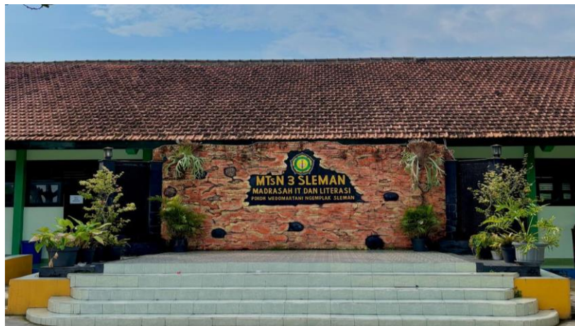
Gambar 2 Panggung MTs Negeri 3 Sleman