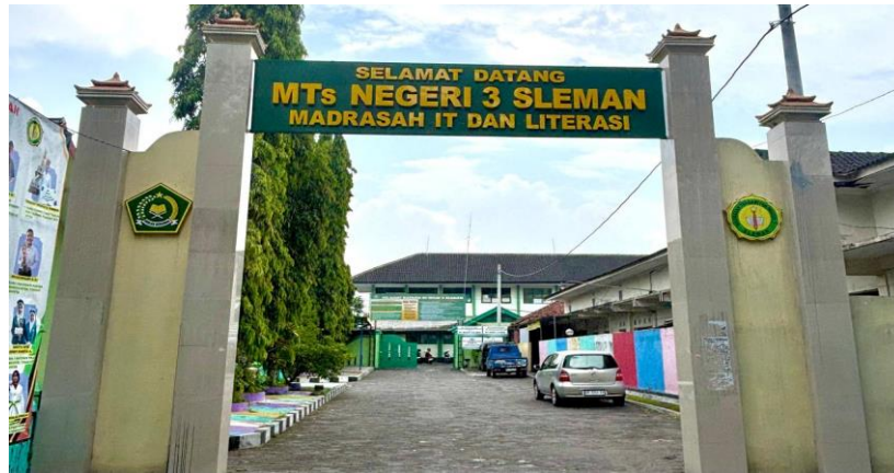
Gambar 1 MTs Negeri 3 Sleman