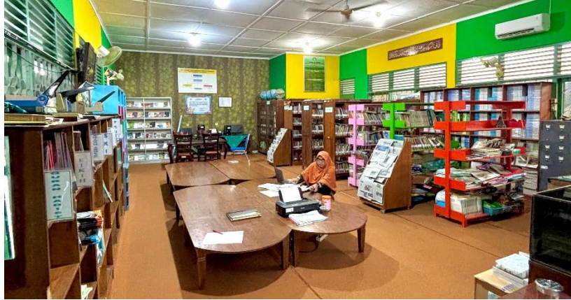
Gambar 4 Ruang Perpustakaan