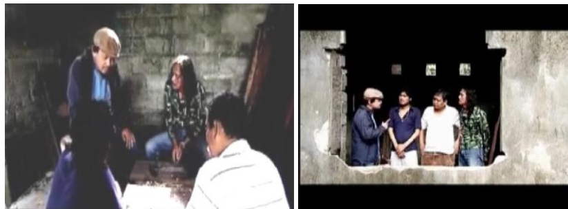
Gambar 4.7 Dakwah Kepada Pemabuk

Cuplikan pada menit 19.13-20.33 ini memperlihatkan dinamika hubungan antara seorang pembimbing (murabbi) dan para pemuda yang ia bimbing melalui metode tarbiyah. Ruang gelap dan tembok kasar yang digunakan sebagai latar memperkuat citra perjuangan yang dijalani para aktivis dakwah.