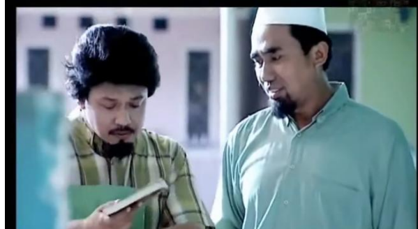
Gambar 4.6 Nasihat Ustadz

Pada adegan di menit 14.38-16.00 menjelaskan bahwa dialog atau nasihat tentang keikhlasan dalam film Sang Murabbi menghadirkan konstruksi visual dan simbolik yang kuat mengenai relasi pendidikan spiritual dalam tradisi Islam. Murabbi yang mengenakan kopiah putih tampil sebagai penanda utama kesucian, keteladanan, dan otoritas moral. Secara denotatif, ia hanya seorang guru agama yang berdialog dengan murid, tetapi secara konotatif, tampilannya memancarkan makna kesalehan dan kedalaman ruhani. Kehadiran kopiah putih, pakaian sederhana, dan ekspresi lembut membangun citra murabbi sebagai figur pembimbing spiritual yang tidak hanya mengajarkan ilmu, tetapi juga memodelkan akhlak. Pada tataran mitos, film menempatkan murabbi sebagai representasi ideal ulama tradisional sosok yang dianggap suci, dihormati, dan menjadi sumber legitimasi moral dalam masyarakat Muslim.