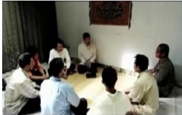
Gambar 4.2 Adegan Duduk Melingkar Bersama Muridnya

Adegan pada menit 39.40-40.00 pada film tersebut menunjukkan tokoh utama duduk melingkar bersama santri dan mempelajari kitab secara denotatif hanya menampilkan guru dan murid dalam suasana pembelajaran. Namun secara konotatif, lingkaran duduk ini melambangkan kesetaraan, kedekatan emosional, kehangatan ukhuwah, dan spirit komunitas Islami, yang memosisikan murabbi sebagai figur dekat, bukan otoritas kaku.