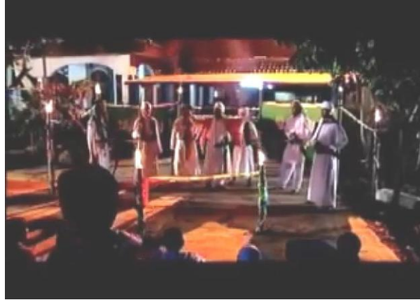
Gambar 4.5 Dakwah Teater

Adegan pada menit 02.16-03.00 pada panggung kayu kecil dengan tali pembatas dan hadirnya bus atau bangunan sebagai latar (penanda pertama dan keenam) menunjukkan secara denotatif sebuah ruang pertunjukan rakyat yang sederhana bukan gedung megah atau panggung formal. Konotasinya menegaskan bahwa kegiatan budaya dan pendidikan berlangsung di ruang komunal yang mudah diakses, sehingga pesan moral atau dakwah tidak terjadi di “menara gading” melainkan di arena kehidupan sehari-hari. Pada tingkat mitos, penggambaran ruang demikian meneguhkan narasi bahwa masyarakat Muslim Nusantara menata ruang sosialnya untuk memelihara tradisi kolektif; dakwah menjadi bagian dari ritme komunitas, bukan aktivitas eksklusif birokratik. Dengan kata lain, film memproduksi citra ideologis bahwa legitimitas religius diperoleh dari keterlibatan nyata dalam praktik budaya lokal, sehingga agama dan kebudayaan tampak bersinergi alih-alih bertentangan.