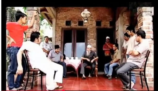
Gambar 4.8 Keresahan Warga Terhadap Metode Dakwah Rahmat

Adegan pada menit 38.43-40.00 adalah diskusi kolektif di antara aktivis atau tokoh Islam denotatif hanya menampilkan beberapa orang berdialog. Konotatifnya memberi makna bahwa pengambilan keputusan dalam komunitas Islam ideal adalah melalui musyawarah, bukan otoritarianisme. Pada level mitos, film menegaskan bahwa kepemimpinan Islam harus berbasis kolektivitas dan musyawarah, bukan dominasi individu sebuah representasi penting dari nilai Islam Nusantara dan demokrasi dalam bingkai dakwah. Penelitian film lokal menunjuk bahwa narasi kolektif dan musyawarah sering muncul dalam film Islami untuk merefleksikan gagasan Islam moderat dan toleran.