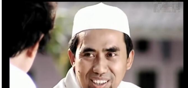
Gambar 4.3 Senyuman Sang Murabbi

Adegan pada menit 10.55-11.00 melambangkan senyuman tokoh saat mengajar pada tataran denotatif hanyalah ekspresi wajah lembut dan ramah seorang guru ketika berinteraksi dengan murid-muridnya. Tidak ada simbol eksplisit selain mimik wajah yang menunjukkan keramahan. Namun, ketika dipindahkan ke ranah konotatif, senyuman itu memunculkan lapisan makna yang lebih dalam: ia menjadi representasi akhlak mulia, kasih sayang, kelembutan hati, dan keteladanan seorang guru Islami yang mengedepankan pendekatan humanis dalam mendidik. Senyuman itu bekerja sebagai tanda nonverbal yang mengomunikasikan bahwa mengajar bukan sekadar kegiatan kognitif, tetapi proses transformatif yang melibatkan empati dan kehangatan emosional.