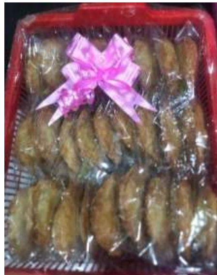
Gambar 4.4 Kucur