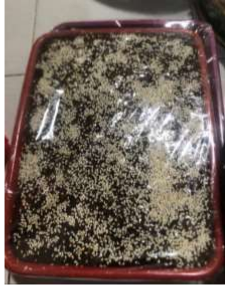
Gambar 4.2 Jenang