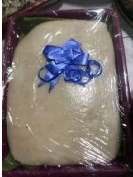
Gambar 4.1 Gemblong

nantinya akan dibagikan kepada keluarga dekat serta tetangga setelah keluarga perempuan kembali ke rumah. 50