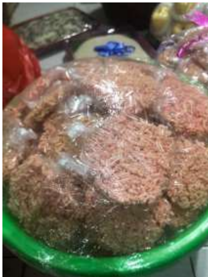
Gambar 4.3 Krecek