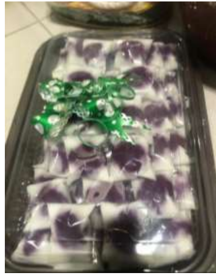
Gambar 4.6 Putri Mandi