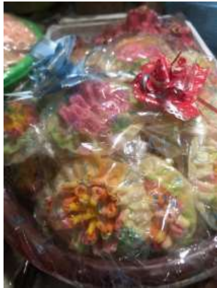
Gambar 4.5 Kembang Goyang