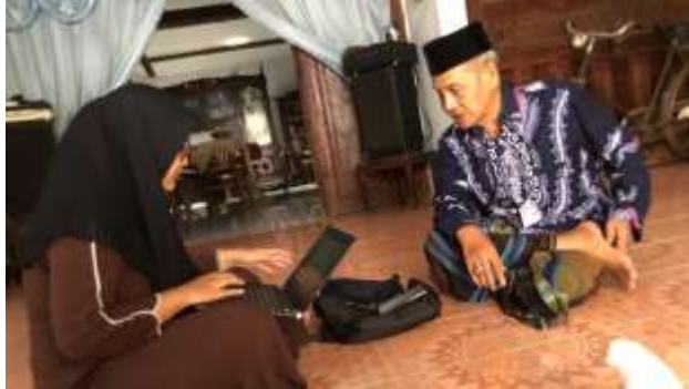
Gambar 1: Wawancara dengan Bapak Bola Tokoh Adat