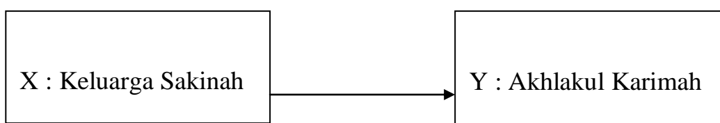
Tabel 3.1 Variabel Bebas dan Terikat