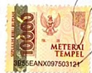
Ghina Aslima Az-zahra