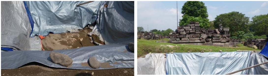
Gambar 4.1 Lokasi pengambilan sample tanah