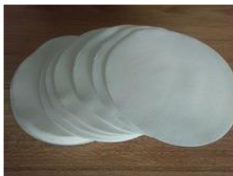
Gambar 4.4 Kertas Saring

Kertas saring berfungsi utk memisahkan partikel suspensi dgn cairan atau untuk memisahkan antara zat terlarut dgn zat padat (Gambar 4.4).