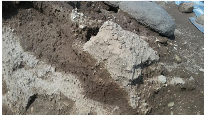
Gambar 4.3 Tanah di bawah Candi Perwara

Dalam penelitian ini, tanah lempung yang digunakan berasal dari hasil galian tanah di bawah Candi Perwara deret II No. 35. Kondisi tanah tersebut masih dalam kondisi tanah asli atau undisturbed (Gambar 4.3).