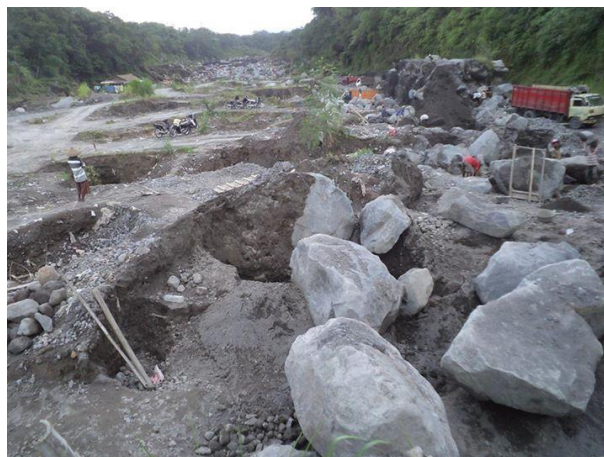
Gambar 4.2 Tanah pasir

Dalam penelitian ini tanah yang digunakan adalah tanah pasir yang diperoleh dari Gunung Merapi (Gambar 4.2)