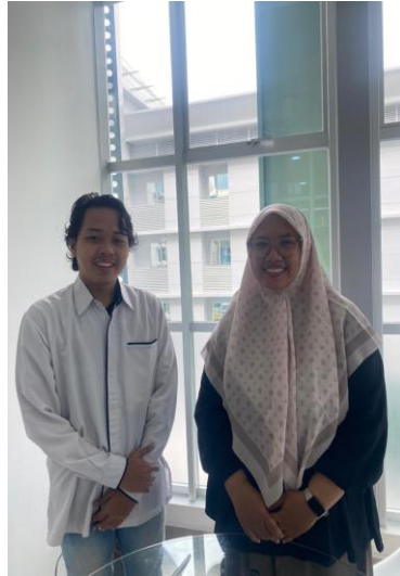
Lampiran 1. 1 Wawancara dengan dosen Pendidikan Agama Islam