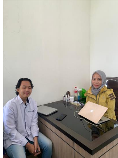
Lampiran 1. 2 Wawancara dengan dosen Akuntansi Perpajakan