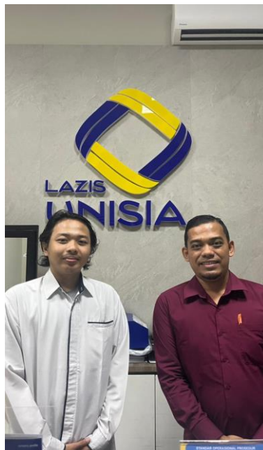
Lampiran 1. 3 Wawancara dengan anggota LAZIS YBW UNISIA