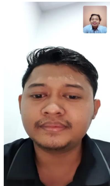
Lampiran 1. 4 Wawancara dengan anggota KPP DJP