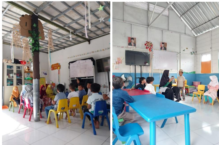
Gambar 4. 3 Kegiatan Morning Circle Time

shalawat , nah setelah itu ada menanyakan kabar, kemudian menanyakan cuaca, setelah itu ada sedikit permainan, nah setelah itu ada News Day Time . Jadi, News Day Time itu adalah bagian kegiatan dari Morning Circle Time . 96