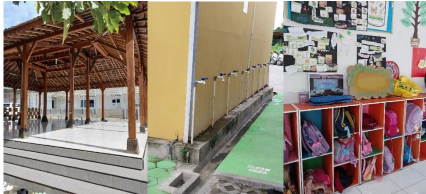
Gambar 4. 1 Sarana dan Prasarana Tahun 2023/2024