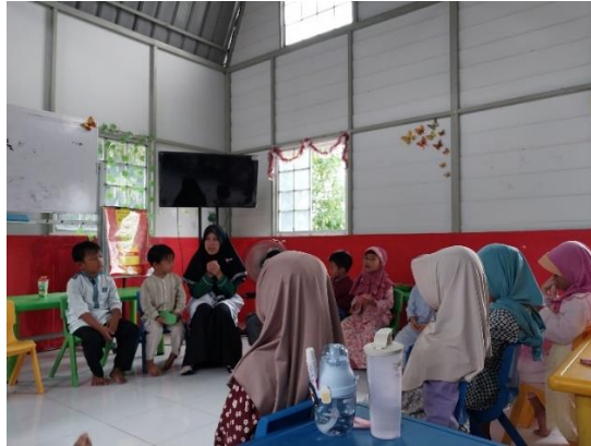
Gambar 4. 6 Kegiatan Dirish

pilihan, hadis pilihan, fiqih ibadah dan do'a harian. 105