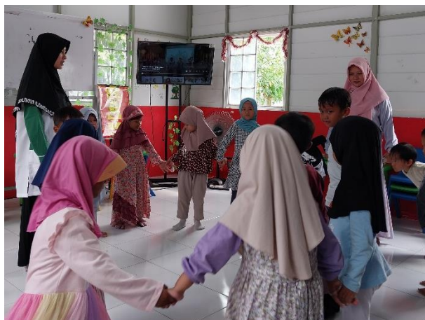
Gambar 4. 2 Melakukan Ice Breaking

Untuk Kindy A ini educator -nya harus bisa luwes untuk bisa mengemong anak gitu atau memikat anak. Caranya mungkin, kita pendekatannya lebih pada memahami ke anaknya, lebih empati ke anaknya. Misalnya kemauan anak seperti apa, lalu gimana kita bisa manage -nya, dan kalau dalam klasikal supaya mereka tertarik kita selipkan ice breaking . Sedangkan, untuk tingkat Kindy B itu mereka lebih matang, ketika follow instruction mendengarkan educator -nya itu lebih mudah memahami pada tingkatan Kindy B ini. 93