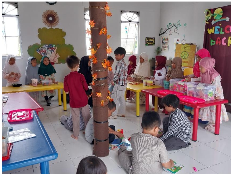
Gambar 4. 5 Role Play pada Materi Matematika

Berikut adalah hasil observasi salah satu contoh bentuk pelaksanaan kegiatan yang ada di jenjang Kindy pada materi Matematika dengan tema Money dalam upaya pembentukan nilai-nilai karakter.