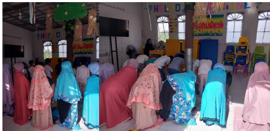
Gambar 4. 4 Shalat Berjamaah

Berdasarkan hasil observasi, kegiatan pendukung lainnya dalam pembentukan karakter ialah Shalat Dhuha berjamaah. Shalat Dhuha ini biasanya dilakukan setelah kegiatan Morning Circle Time (MCT). Dengan tujuan sebagai bentuk pengenalan agama dan pembiasaan diri, praktik pembelajaran serta pembentukan karakter. 97