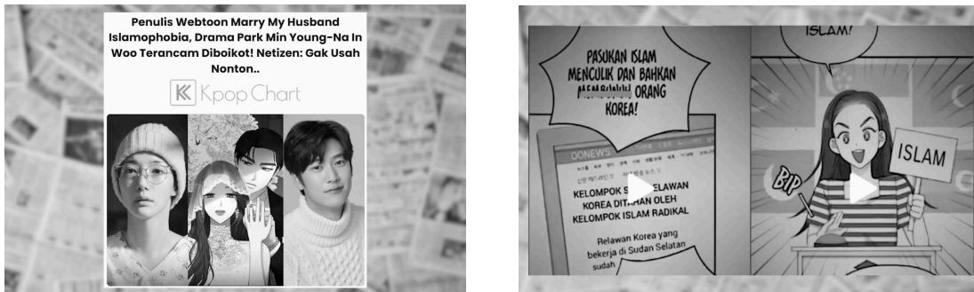
Gambar 3. Webtoon di Korea Selatan yang menggambarkan komunitas muslim sebagai kelompok teroris