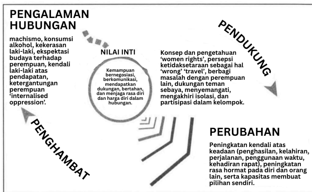
Gambar 3. Empowerment within close relationships