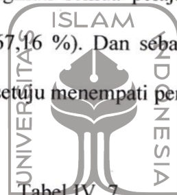
Tabel IV. 7 Siswa Aktif Bila Ada Kesempatan Bertanya

Sikap siswa dalam mengikuti semua mata pelajaran sebagian besar tidak setuju dan sangat tidak setuju mengikuti semua pelajaran dengan penuh perhatian dengan persentase sebesar (67,16 %). Dan sebagian kecil siswa menyatakan tidak setuju dan sangat tidak setuju menempati persentase (32,84 %).