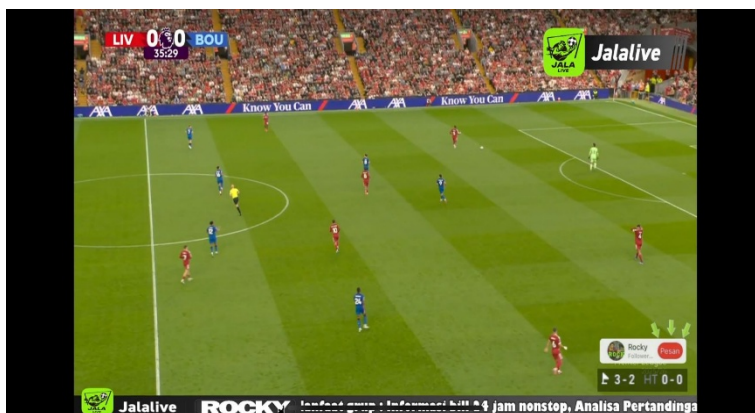
Gambar 1 tangkapan layar siaran pertandingan Liga Inggris yang ditayangkan melalui aplikasi JalaLive tanpa izin resmi

Sebagai penguat uraian tersebut, berikut penulis memperlihatkan bukti visual berupa tangkapan layar siaran pertandingan Liga Inggris yang ditayangkan melalui aplikasi JalaLive tanpa izin resmi dari pemegang hak siar. Tanda logo JalaLive yang terpampang jelas di layar menunjukkan adanya aktivitas penyiaran konten berlisensi secara ilegal.