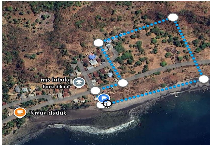
Gambar 3. 1

Peta Tanah Ulayat Obyek Sengketa di Dusun 4 (empat).