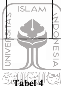
Tabel 4 Data Ruang Lain di SMPN 1 Bandongan, Magelang