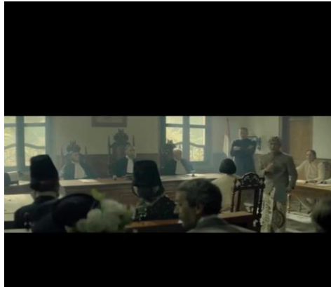
Gambar 3. 6 Scene keenam