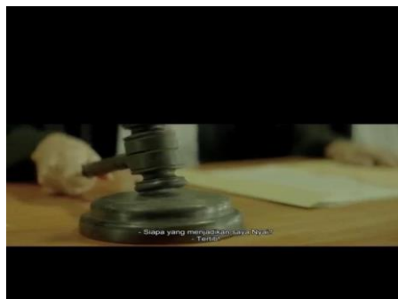
Gambar 3. 3 Scene ketiga