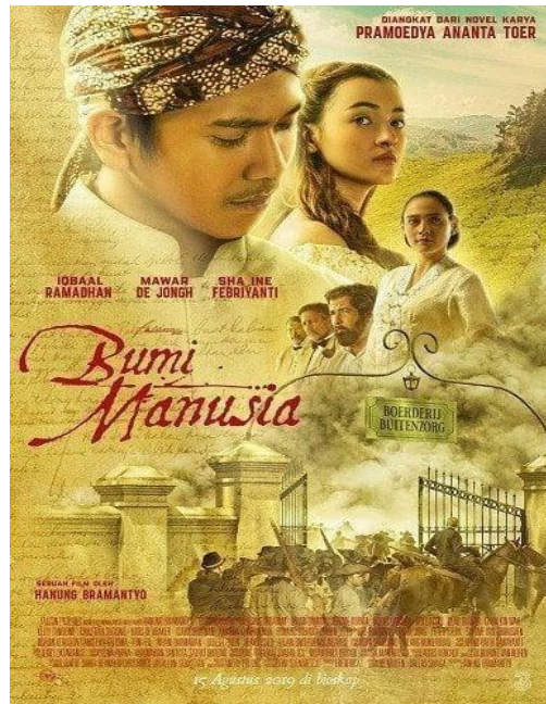
Gambar 2. 1 Poster film Bumi Manusia

Bumi Manusia merupakan film Indonesia yang memiliki durasi 3 jam 1 menit, ditayangkan melalui bioskop dan dirilis pada tahun 2019. Film ini juga dapat disaksikan oleh penonton global melalui platform Netflix. Diperankan oleh para artis papan atas asli Indonesia yaitu, pemeran utama laki-laki diperankan oleh Iqbaal Ramadhan sebagai Minke, dan pemeran utama perempuan dimainkan oleh Mawar Eva de Jongh sebagai Annelies. Digarap oleh sutradara bernama Hanung Bramantyo. Dimana sutradara tersebut terkenal menghasilkan karya yang ciamik dan kerap bekerja sama dengan aktor dan aktris papan atas.