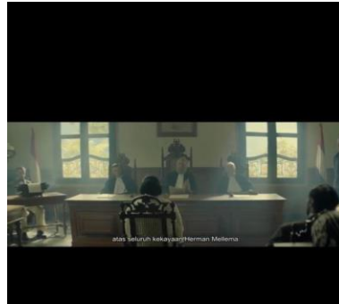
Gambar 3. 5 Scene kelima