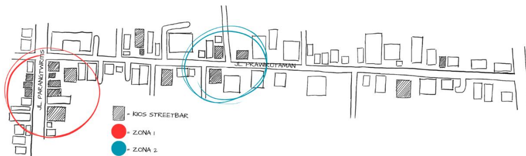
Gambar 1 : Blind Map

Lokasi penelitian berada pada kios - kios streetbar yang tersebar di sepanjang Jalan Prawirotaman dan Jalan Parangtritis, Kec. Mergangsan, Kota Yogyakarta, Daerah Istimewa Yogyakarta. Berikut merupakan mapping area streetbar berdasarkan zona yang dibedakan dengan