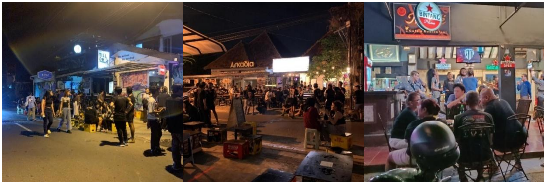
Gambar 4: Dokumentasi Situasi Kios-Kios Streetbar

Selain itu, banyak pengunjung, terutama turis lokal maupun mancanegara, menjadikan area ini sebagai tempat berkumpul. Mereka sering berinteraksi di area terbuka, seperti trotoar atau tempat duduk di luar bar . Suasana ini sering kali diiringi dengan aktivitas santai seperti berbincang atau bahkan berdansa di ruang terbuka. Fleksibilitas ruang publik ini mendukung terciptanya teritorialitas sementara, di mana area tersebut seolah menjadi milik bersama.