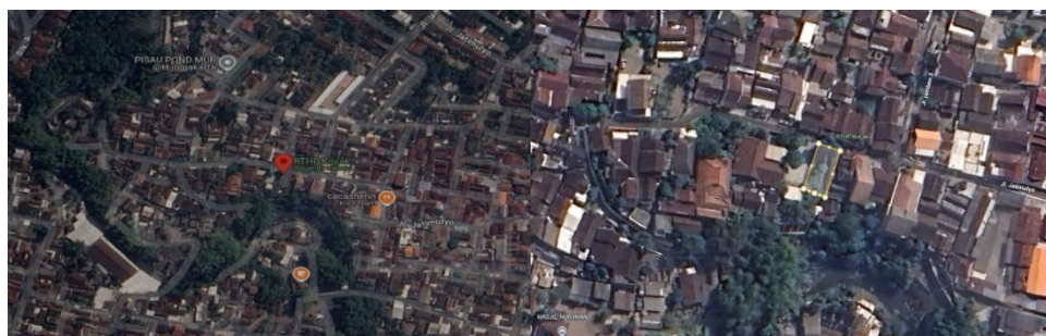
Gambar 1 lokasi RTHP kricak

Studi kasus ini berlokasi di RTHP Kricak , Kricak, Kecamatan Tegalrejo, Kota Yogyakarta, Daerah Istimewa Yogyakarta. Penelitian ini berkaitan dengan peran ruang publik di tengah dinamika urbanisasi. Tujuan penelitian ini adalah untuk mengevaluasi bagaimana ruang publik mampu berfungsi sebagai ruang interaksi sosial, mitigasi dampak ekologis, dan katalis ekonomi di wilayah perkotaan. Studi ini menggunakan pendekatan kualitatif dengan analisis data sekunder yang diperoleh dari berbagai sumber, termasuk kebijakan pemerintah, studi kasus, dan literatur terkait.