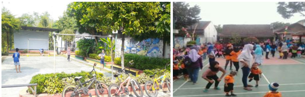
Gambar 4 Aktifitas Masyarakat

RTHP Kricak menjadi tempat yang aktif digunakan oleh masyarakat untuk berbagai kegiatan sehari-hari. Aktivitas yang sering dilakukan meliputi rekreasi ringan, seperti duduk santai menikmati suasana, berolahraga ringan, hingga berkumpul bersama teman atau keluarga. Ruang ini juga berfungsi sebagai pusat aktivitas sosial, di mana warga sering mengadakan arisan, pertemuan RT, atau acara komunitas lainnya. Selain itu, anak-anak memanfaatkan area ini sebagai tempat bermain, menjadikannya ruang yang aman dan menyenangkan bagi mereka. Pada momen tertentu, RTHP Kricak juga digunakan untuk acara budaya atau kegiatan seni lokal, tidak hanya memperkuat identitas budaya masyarakat setempat, tetapi juga memberikan hiburan dan edukasi bagi pengunjung.