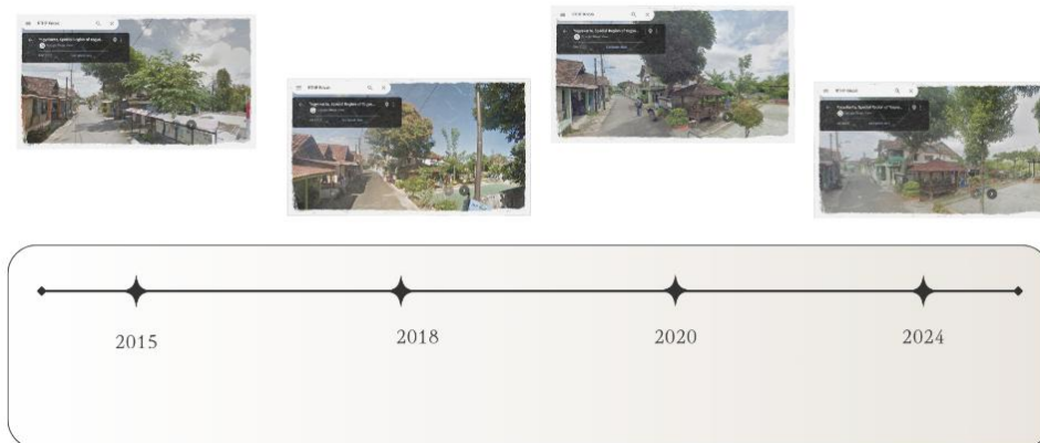
Gambar 5 Perkembangan lingkungan RTHP kricak

sejuk, meskipun jenisnya masih terbatas. Keberadaan pohon-pohon ini menjadi elemen penting dalam mengurangi dampak panas di lingkungan urban. Dari segi kebersihan, kondisi area relatif terjaga berkat kesadaran masyarakat sekitar, namun tantangan tetap ada, terutama terkait sampah yang kadang ditinggalkan oleh pengunjung. Selain itu, lokasi RTHP Kricak yang berada di kawasan urban padat membuat kualitas udara sedikit terpengaruh oleh aktivitas kendaraan bermotor di sekitarnya, Meskipun demikian, kehadiran ruang hijau ini membantu mengurangi dampak negatif polusi dalam skala lokal.