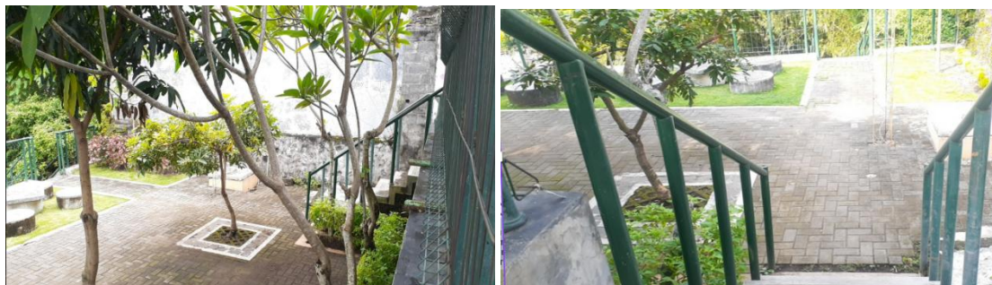
Gambar 6 Aksesibilitas

Aksesibilitas pada RTHP Kricak masih terdapat beberapa kekurangan yang perlu diperhatikan. Terkait fasilitas untuk difabel yang belum sepenuhnya memadai, meskipun beberapa area telah dilengkapi dengan jalur landai, memberikan sedikit kemudahan bagi pengguna dengan kebutuhan khusus. Dari segi transportasi umum, lokasi ini cukup mudah dijangkau dari jalan utama, tetapi pengunjung yang menggunakan bus atau transportasi umum lainnya sering kali harus berjalan kaki cukup jauh dari halte terdekat. Jalur pejalan kaki tersedia, namun lebarnya yang terbatas membuatnya kurang nyaman, terutama saat pengunjung ramai. Selain itu, fasilitas parkir sepeda masih minim, sehingga pengguna sepeda mungkin kesulitan untuk memarkir kendaraan mereka dengan aman dan nyaman.