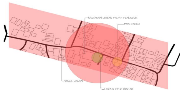
Gambar 7 Plotting Siteplan RTHP

Lokasi RTHP Kricak yang merupakan ruang publik yang sangat terjangkau bagi masyarakat, karena tidak memungut biaya masuk. Lokasinya yang strategis dan dekat dengan permukiman warga di sekitar Kecamatan Tegalrejo menjadikannya mudah diakses oleh penduduk setempat, sehingga menjadi tempat favorit untuk rekreasi sehari-hari. Namun, fasilitas pendukungnya belum sepenuhnya memadai Area parkir yang terbatas sering menjadi kendala bagi pengunjung dengan kendaraan pribadi, sementara fasilitas sanitasi juga masih minim, yang dapat memengaruhi kenyamanan pengguna dalam jangka panjang. Hal ini menunjukkan perlunya pengembangan fasilitas agar ruang publik ini dapat memberikan pelayanan yang lebih optimal.