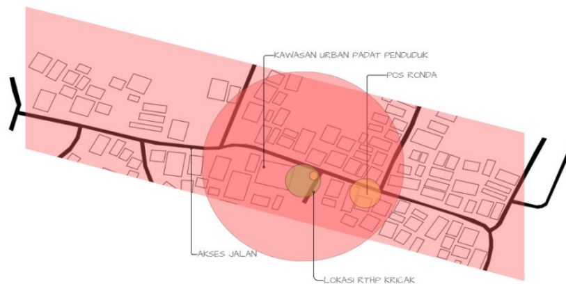
Gambar 3 Plotting Siteplan RTHP