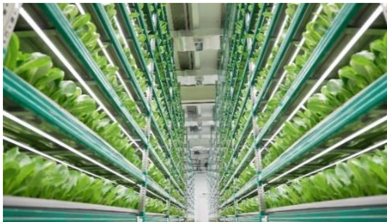
Gambar 4 Vertical Farming

Studi ini menunjukkan bahwa pertanian perkotaan, khususnya pengenalan sistem pertanian vertikal, dapat menjadi solusi efektif untuk meningkatkan ketahanan pangan di Kecamatan Umbulharjo, Kota Yogyakarta. Mengingat pesatnya urbanisasi dan terbatasnya lahan pertanian, maka pertanian vertikal dapat diterapkan untuk memanfaatkan ruang vertikal untuk menanam berbagai sayuran seperti bayam, selada, kangkung, tomat, dan bok choy dengan efisiensi ruang yang tinggi. Berdasarkan perhitungan, kebutuhan sayur mayur harian sebanyak 14.107,6 kg di Kecamatan Umbulharjo dapat dipenuhi dengan memperkenalkan kurang lebih 4.947 unit pertanian vertikal. Jika dibandingkan dengan luas wilayah, terlihat bahwa penggunaan vertical farming lebih efisien dalam hal penggunaan lahan. Luas lahan yang dibutuhkan untuk lima jenis sayuran adalah 12.620 meter persegi, jauh lebih kecil dibandingkan cara tradisional yang membutuhkan 59.354 meter persegi. Hal ini menunjukkan bahwa pertanian vertikal merupakan solusi efisien untuk mendukung produksi pangan di daerah dengan lahan terbatas.