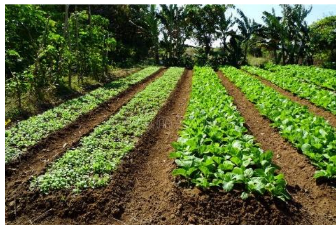
Gambar 5 Lahan tanah/tradisional