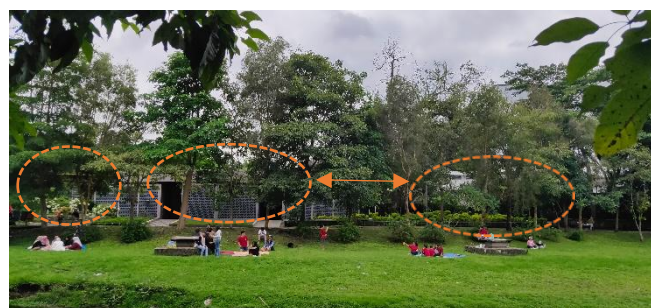
Gambar 7. a: Area Publik di Wisdom Park Sumber: Google earth diolah oleh penulis, 2024

Wisdom Park merupakan bagian dari area terbuka hijau milik UGM termasuk fasilitas olahraga di dalam dan luar ruangan, lintasan jogging , konservasi lahan, area bercocok tanam perkotaan, aneka fasilitas rekreasi, dan ruang rapat. Wisdom Park ini dibuka tidak hanya untuk internal namun juga untuk umum. Wisdom Park merupakan kawasan publik sangat populer di kalangan mahasiswa. Beberapa aktivitas tergambar pada gambar, merupakan suatu kegiatan bersifat publik, dimana terdapat berbagai macam aktivitas seperti membaca, bercakap, bermain dan lain sebagainya. Pada kawasan tersebut dikatakan ruang publik, karena terdapat berbagai aktivitas masyarakat berbeda-beda, sehingga membentuk ruang sosial dan memungkinkan terjadinya interaksi antar kelompok atau individu.