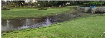
Gambar 11: Kali belik Wisdom Park sisi selatan sudah tercemar