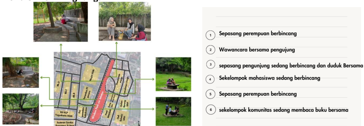
Gambar 6. a: Kondisi Fisik Lingkungan UGM

Wisdom Park ini terletak di Jl. Prof. DR. Drs Notonagoro, Karang Malang, Caturtunggal, Kec Depok, Kabupaten Sleman, Daerah Istimewa Yogyakarta. Kawasan kawasan eksisting ada di area Wisdom Park diantaranya: BSI KCP Yogyakarta UGM, Pos pemadam kebakaran, Danareksa PT Persero, kompleks, Hotel MMUGM, Labolatorium Klinik Hewan, Pusat studi kependudukan, dan pemukiman warga. Terdapat beberapa aktivitas atau kegiatan sering atau terjadi di kawasan Wisdom Park. Seperti olahraga, mengerjakan tugas, membaca buku, atau sekadar berbincang.