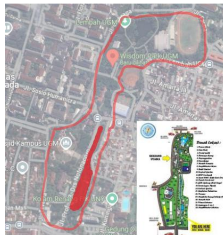
Gambar 2. a: Peta Wisdom Park UGM

Penting untuk memahami dan menghormati ruang personal ini demi kenyamanan bersama. Wisdom Park perlu menyeimbangkan antara ruang publik dan ruang personal. Pemisahan dan keterhubungan antara ruang publik dengan ruang privat di dalam lingkup wilayah urban sangat penting dan memengaruhi kehidupan masyarakat dalam banyak hal (Anggraini, L. D., 2024). Ruang-ruang publik memiliki peran sebagai ruang simpan memori bersama collective memory , sekaligus tempat untuk berekspresi secara budaya (Kirby, 2008). Ruang-ruang publik juga menjadi pemersatu ruang-ruang pribadi, dibatasi secara berbeda seperti diberikan batasan fisik, atau tidak disediakan akses pejalan kaki, dan seterusnya. Mendorong individual untuk saling berinteraksi di ruang-ruang publik. Sebuah studi tentang ruang publik di wilayah urban menunjukkan pengelompokan ruang berdasarkan pada kepemilikan dan aksesibilitasnya (Johnson & Glover, 2013).