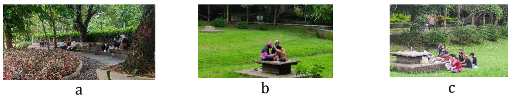
Gambar 9. a: Sekelompok mahasiswa sedang berbincang, b: sepasang pengunjung sedang bercakap dan duduk bersama, c: sekelompok komunitas sedang membaca buku bersama

Berdasarkan wawancara telah dilakukan di area tersebut, kualitas dari ruang privasi di katakan cukup nyaman, dimana pada data tersebut mahasiswa memiliki nilai atau suara terbanyak dengan jumlah perolehan 3 orang daripada pengunjung lainnya. Berdasarkan wawancara setempat, menurut narasumber Wisdom Park memiliki kualitas privat cukup nyaman bagi kalangan mahasiswa. Tidak hanya tempatnya cukup luas, terdapat beberapa elemen atau fasilitas cukup memadai untuk melakukan aktivitas seperti: membaca, mengerjakan tugas, dan berbincang. Meskipun pada area tersebut cukup ramai oleh pengunjung, dan tidak ada batasan seperti adanya ruang memiliki pembatas, sehingga bebas dari pandangan orang lain berlalu lalang, mahasiswa tidak terganggu atau merasa nyaman dengan hal tersebut. Tetapi narasumber lebih memperhatikan keinginan menjauh dari kebisingan seperti halnya duduk di tempat jauh dari kebisingan lalu lintas ( seclusion ) dan area pejalan kaki. Dimana narasumber memilih area di bawah pohon rindang, terdapat tempat duduk dan area memungkinkan bisa membuat mahasiswa tersebut tidak mengganggu individu atau kelompok lainnya.