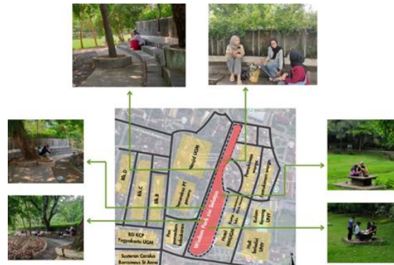
Gambar 8. a: Area Privat di Wisdom Park

Privasi adalah tingkatan interaksi atau keterbukaan dikehendaki seseorang pada suatu kondisi atau situasi tertentu. Dalam kasus ini manusia bisa sekaligus menunjukkan dua sisi kepribadian: sebagai makhluk sosial bermasyarakat dan sebagai individu