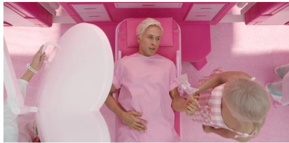
Gambar 3. 11 Barbie menolong Ken

norma gender tradisional. Adegan ini menggambarkan maskulinitas Ken ditampilkan sebagai rapuh, dan menjadi kritik sistem patriarki dengan membalikkan peran gender. Maskulinitas Ken justru terlihat tidak stabil, sedangkan Barbie menjadi sosok yang berkuasa tanpa perlu bergantung pada laki-laki.