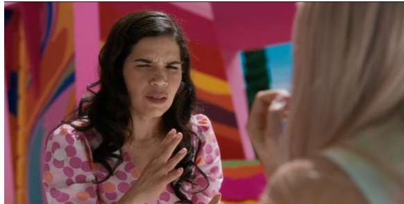
Gambar 3. 12 Dialog Gloria dan Barbie

Dialog antara Gloria dan Barbie menjadi momen krusial yang mencerminkan munculnya kesadaran gender yang semakin mendalam. Dalam adegan tersebut, Gloria melontarkan monolog dilemma yang kerap dihadapi perempuan dalam keseharian. Dari tuntutan untuk menjadi tangguh namun tetap menunjukkan kelembutan sampai tuntutan untuk menhejar kesuksesan karier tanpa mengesampingkan tanggung jawab dalam keluarga. Narasi ini menyuarakan kritik terhadap standar ganda yang dilekatkan pada perempuan dan menekankan bahwa tekanan tersebut berakar pada sistem sosial yang mengatur peran gender, bukan hanya persoalan individu.