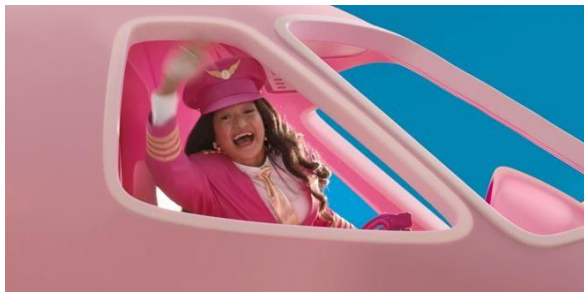
Gambar 3. 2 Barbie berprofesi sebagai pilot

Adegan di atas menampilkan Barbie dengan profesi beragam, mulai dari astronot, pemadam kebakaran, atlet, pilot, ilmuwan, dan dokter. Potongan adegan ini menunjukkan dunia fantasi Barbieland sebagai tempat di mana perempuan tidak dibatasi oleh norma gender dalam menentukan peran atau kariernya. Dalam Barbieland, perempuan diberi ruang seluas-luasnya untuk mengeksplorasi potensi mereka tanpa harus menghadapi hambatan struktural atau stereotip yang kerap ditemui di dunia nyata.