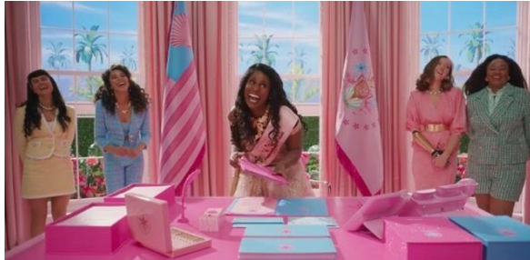
Gambar 3. 8 Barbie sebagai seorang presiden

perempuan dalam masyarakat. Di Barbieland, para Barbie memegang peran-peran penting, termasuk menjadi presiden, yang menandakan bahwa posisi kepemimpinan terbuka lebar bagi perempuan.