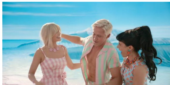
Gambar 3. 10 Barbie menolong Ken

Adegan di atas menampilkan Ken berusaha menarik perhatian Barbie di pantai, menunjukkan bahwa eksistensinya bergantung pada validasi Barbie. Sementara itu, Barbie tetap terlihat tenang dan dominan, mencerminkan struktur sosial Barbieland yang membalikkan