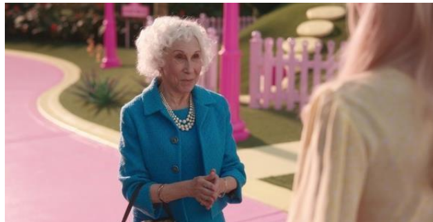
Gambar 2. 4 Ruth Handler

Ruth Handler, yang diperankan oleh Rhea Perlman, adalah sosok penting yang merepresentasikan pencipta dari Barbie. Sebagai wanita visioner dan inovatif, Ruth berperan sebagai simbol pemberdayaan perempuan. Ruth memberikan wawasan kepada Barbie tentang arti kebebasan dan pilihan, menegaskan bahwa Barbie bukan hanya sekedar boneka, tetapi juga representasi berbagai kemungkinan bagi perempuan. Melalui perbincangan mereka, Ruth mendorong Barbie untuk menjelajahi identitasnya dan memahami tantangan yang dihadapi perempuan di dunia nyata, sekaligus menekankan pentingnya keberanian dan inovasi dalam melawan norma-norma sosial.