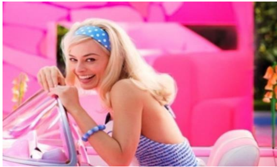
Gambar 2. 2 Barbie

Barbie, tokoh utama dalam film Barbie (2023) yang diperankan oleh Margot Robbie, merupakan karakter ceria dan optimis yang hidup di dunia ideal Barbieland. Di Barbieland, perempuan tampak menguasai segalanya dan hidup dalam gambaran yang sempurna. Namun seiring berjalannya waktu, Barbie mulai merasakan kehampaan dan mempertanyakan ekspektasi yang dibebankan padanya sebagai simbol perempuan sempurna. Perubahan fisik dan emosional yang dialami Barbie mendorongnya untuk mencari makna hidup yang lebih dalam, sehingga Barbie memutuskan untuk pergi ke dunia nyata. Di dunia nyata, Barbie dihadapkan dengan realitas sosial yang penuh dengan ketimpangan gender, diskriminasi, dan tekanan terhadap perempuan. Interaksinya dengan Gloria, seorang ibu pekerja yang mengalami tekanan sosial, membuka mata Barbie tentang pentingnya keberanian, solidaritasi antarperempuan, dan keberagaman dalam perjuangan feminis.