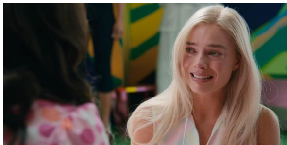
Gambar 3. 13 Dialog Gloria dan Barbie

Dialog antara Gloria dan Barbie menjadi momen krusial yang mencerminkan munculnya kesadaran gender yang semakin mendalam. Dalam adegan tersebut, Gloria melontarkan monolog dilemma yang kerap dihadapi perempuan dalam keseharian. Dari tuntutan untuk menjadi tangguh namun tetap menunjukkan kelembutan sampai tuntutan untuk menhejar kesuksesan karier tanpa mengesampingkan tanggung jawab dalam keluarga. Narasi ini menyuarakan kritik terhadap standar ganda yang dilekatkan pada perempuan dan menekankan bahwa tekanan tersebut berakar pada sistem sosial yang mengatur peran gender, bukan hanya persoalan individu.