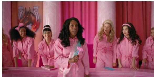
Gambar 3. 9 Barbie sebagai seorang presiden

Adegan tersebut menggambarkan bahwa perempuan mampu mengambil posisi strategis dalam masyarakat, serta menegaskan pentingnya kesetaraan dalam ruang kepemimpinan. Barbie sebagai presiden menegaskan kepemimpinan perempuan bukan sekedar kemungkinan, melainkan sudah menjadi kenyataan yang diterima di dunia tersebut. Penggambaran ini tidak sekedar menampilkan kebebasan dalam memilih peran, tetapi juga memperlihatkan bahwa perempuan memiliki kapasitas dan hak untuk menempati posisi penting dalam proses pengambilan keputusan.