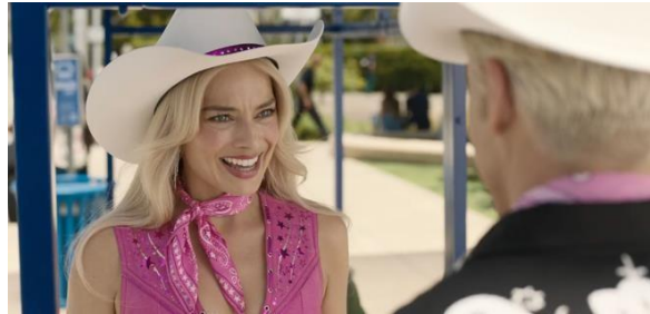
Gambar 3. 4 Barbie dan Ken di dunia nyata

Barbie mulai menyadari perbedaan besar antara dunia fantasi Barbieland dan dunia nyata yang ia masuki. Dalam adegan ini, posisi-posisi penting dan kekuasaan justru didominasi oleh laki-laki, berbeda dengan Barbieland di mana perempuan memegang semua peran penting. Hal tersebut membuat Barbie menyadari ketimpangan gender yang masih terjadi di dunia nyata.