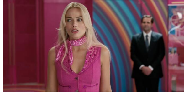
Gambar 3. 7 Barbie menyadari adanya perbedaan

Adegan tersebut memperlihatkan Barbie yang sedang memasuki gedung perusahaan Mattel, melihat mayoritas pekerja dan pimpinan merupakan laki-laki. Perbedaan antara Barbieland dan dunia nyata digambarkan secara kontras, Barbieland dipimpin oleh perempuan dan dunia nyata yang didominasi oleh laki-laki, di mana Barbie merasa asing dengan dunia tersebut.