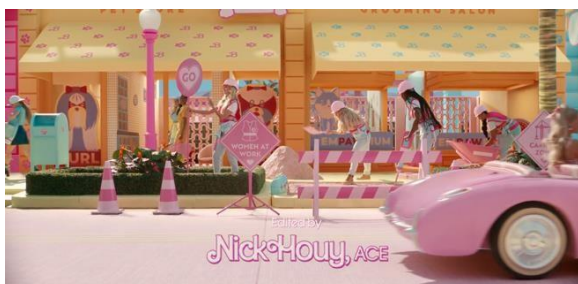
Gambar 3. 3 Barbie berprofesi sebagai pekerja konstruksi

Terdapat adegan di mana para Barbie bekerja dalam pembangunan jalan di Barbieland. Dalam adegan ini, menampilkan Barbie sebagai sosok yang terlibat langsung dalam pekerjaan yang dalam dunia nyata sering dianggap sebagai pekerjaan laki-laki. Para Barbie menunjukkan bahwa perempuan juga memiliki kapasitas untuk terlibat dalam bidang yang selama ini didominasi laki-laki. Adegan ini menyiratkan bahwa pekerjaan tidak semestinya dibatasi oleh peran yang dibentuk oleh norma sosial.