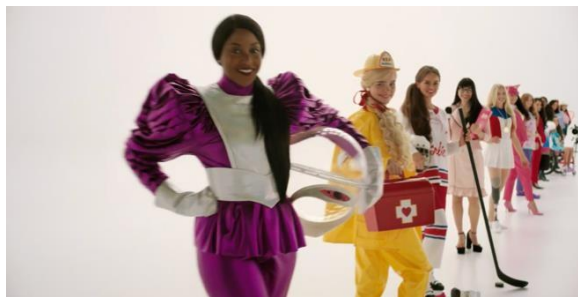
Gambar 3. 1 Barbie dengan berbagai profesi

Barbie digambarkan sebagai karakter dengan pekerjaan yang bebas menjadi salah satu simbol utama pemberdayaan perempuan. Di Barbieland, para Barbie tidak terbatas pada satu jenis pekerjaan atau peran tertentu, mereka bebas memilih jalur hidup yang mereka inginkan.