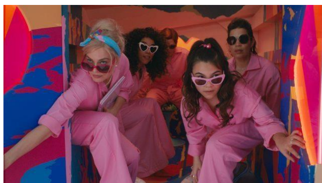
Gambar 2. 5 Karakter Perempuan lainnya

Karakter perempuan dan Barbie lainnya, memperkuat tema pemberdayaan dan kesetaraan gender. Tokoh Midge menunjukkan bahwa setiap perempuan memiliki cerita unik dan hak untuk menjadi diri sendiri. Dr. Barbie merepresentasikan keahliannya di bidang STEM, membuktikan bahwa perempuan dapat mencapai posisi tinggi. Weird Barbie, dengan gaya eksentriknya, menonjolkan keberanian dan kebebasan berekspresi. Karakter-karakter ini mewakili beberapa profesi, seperti presiden, hakim, dan astronot, tanpa mengalami diskriminasi.