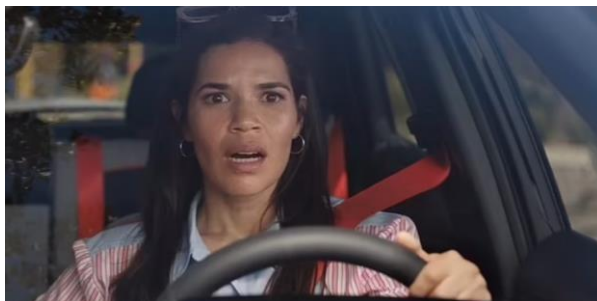
Gambar 2. 3 Gloria

Gloria, yang diperankan oleh America Ferrera, merupakan karakter kuat, inspiratif, dan penuh empati dalam film Barbie (2023). Sebagai seorang ibu dan pekerja di dunia nyata, Gloria sering menghadapi tekanan sosial serta stereotip gender yang membatasi ruang geraknya. Meskipun demikian, Gloria tetap menjaga semangat, idealisme, dan harapan untuk kehidupan yang lebih setara. Saat Barbie memasuki dunia nyata, Gloria berperan penting dalam membantu Barbie memahami realitas keras yang dihadapi perempuan. Gloria berbagi pengalaman pribadinya dengan Barbie mengenai perjuangan melawan ekspektasi yang tidak adil, serta memberikan