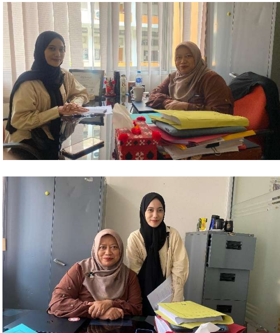
Gambar 3. Wawancara dengan Narasumber Muhammadiyah Kepala Divisi Keluarga dan Masyarakat MTT Muhamadoyah Yogyakarta