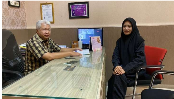
Gambar 4. Wawancara dengan Ahli Medis