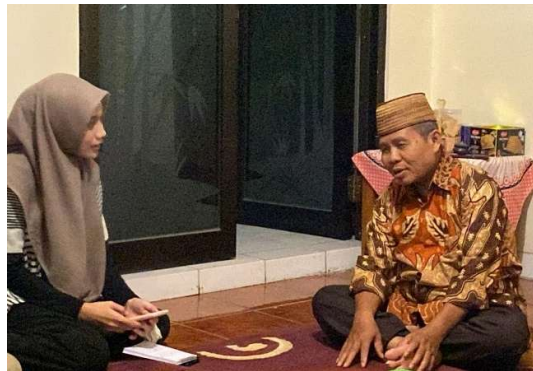
Gambar 2. Wawancara dengan Narasumber dari Ketua Pimpinan Wilayah Nahdhatul Ulama D.I Yogyakarta