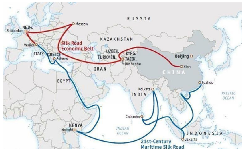
Gambar 2.2 Peta Jalur Sutra