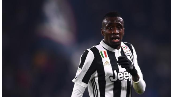
Gambar 2.4 Matuidi Saat Membela Tim Juventus