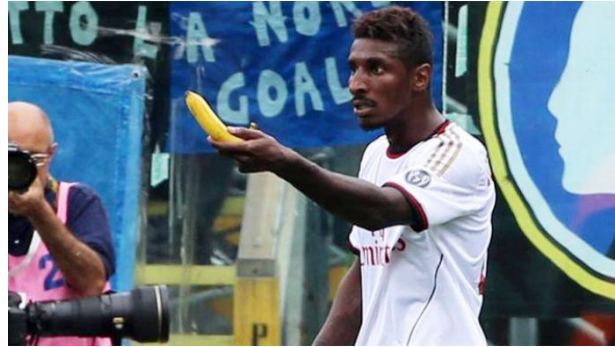
Gambar 2.1 Mario Balotelli dilempari Kulit Pisang