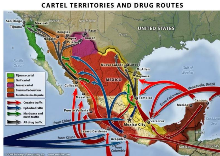
Gambar 2. Jalur Narkotika dari Meksiko ke Amerika Serikat