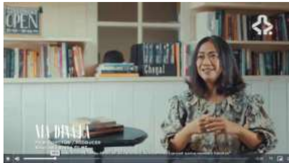
Gambar 3. 13 Part 5 Film MRA

Pada scene tersebut, tergambar bahwasannya saat ini perempuan tak hanya sebagai objek dalam narasi film, tetapi berkembang menjadi subjek aktif dalam berbagai aspek produksi film. Tergambar pada adanya perempuan yang mengambil peran krusial seperti sutradara, penulis naskah, produser film, dan posisi teknis yang sebelumnya didominasi laki-laki. Di Babak terakhir ini, Ersya menarasikan peran perempuan dalam perfilman Indonesia dengan menghadirkan Meiske, Nia Dinata dan Ida Farida sebagai representasi sutradara perempuan masa kini.