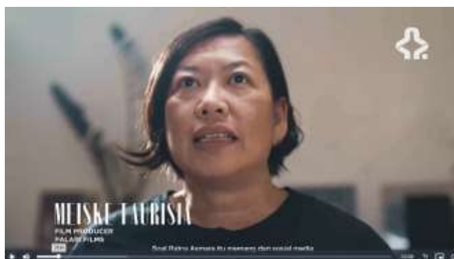
Gambar 3. 11 Part 5 Film MRA

Film Merangkai Ratna Asmara , menjadi film yang mengeksplorasi sudut pandang perempuan. Ersya mencoba untuk menghadirkan sutradara-sutradara masa kini yang karyanya sudah dinikmati banyak masyarakat. Dengan demikian, film MRA bukan hanya sekedar film dokumenter yang memperkenalkan sosok Ratna Asmara, namun juga menjadi panggilan untuk melanjutkan dan merayakan perempuan dalam perfilman Indonesia (Amanda, 2023).