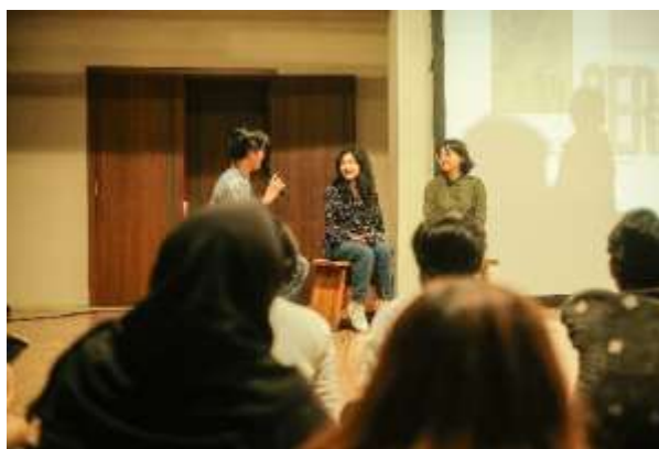
Gambar 1. 1 Sesi Diskusi pada Hari Film Nasional Pemutaran Sinemaria (2024)

menjadi informan dalam penelitian ini. Komunitas Sinemaria merupakan komunitas yang berfokus pada diskusi film dan merayakan sinema melalui seni sinematografi. Komunitas Sinemaria mengadakan berbagai kegiatan. Komunitas film dipilih karena kedekatannya terhadap film menyumbangkan narasi yang lebih dekat dan koheren dengan penelitian ini. Tidak berhenti disitu, komunitas Sinemaria juga menjadi target yang teredukasi film ini yang mana komunitas ini menjadi salah satu ruang yang turut merayakan film Merangkai Ratna Asmara yang selanjutnya akan penulis lanjutkan dengan penulisan MRA, pada hari film nasional 30 Maret 2024.