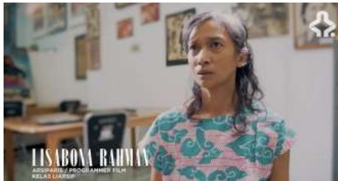
Gambar 2. 4 Lisabona Rahman Arsiparis/Programmer Film Kelas Liarsip (Sumber: https://indonesiana.tv/search?q=ratna%20asmara , 2023)

Lisa berpendapat bahwa penting bagi masyarakat luas, tidak hanya kalangan penggiat film, untuk mengenal sosok Ratna Asmara sebagai bagian penting dari sejarah perfilman Indonesia. Dalam pandangannya, sejarah perfilman Indonesia cenderung didominasi oleh figur laki-laki, yang menyebabkan adanya ketimpangan representasi gender dalam narasi sejarah tersebut. Lisa meyakini bahwa membaca sejarah film Indonesia secara eksklusif melalui tokoh laki-laki akan menghasilkan pemahaman yang kurang utuh dan bahkan bias terhadap kontribusi perempuan yang juga memainkan peran signifikan. Ratna Asmara, sebagai salah satu sutradara perempuan pertama di Indonesia, menawarkan perspektif dan kontribusi berbeda yang penting untuk dicatat agar sejarah film Indonesia dapat dipahami secara lebih komprehensif dan inklusif.