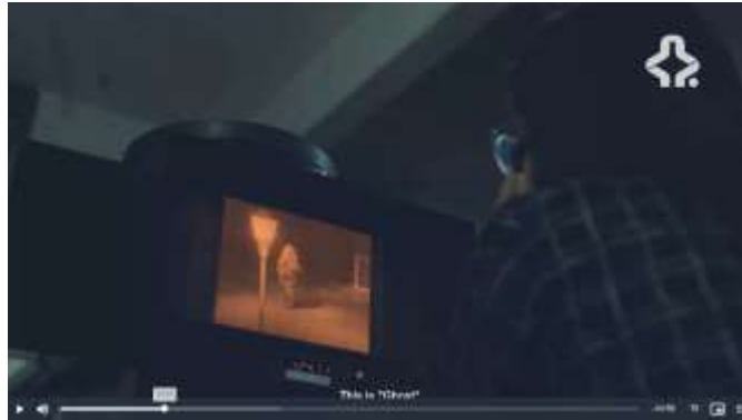
Gambar 3. 6 Part 3 Film MRA

sutradara tidak harus selalu laki laki, karena perempuan ternyata juga mampu mengambil peran-peran teknis di balik layar yang lebih dari sekedar penulis naskah (Amanda, 2023).