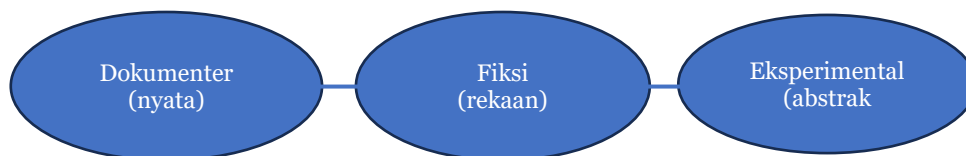
Gambar 1. 3 Kategori Film dalam Buku Memahami Film (Pratista, 2008)

untuk film cerita panjang yang berdurasi 60 hingga 100 menit. Menurut Pratista (2008:7-10) film dapat dikategorikan menjadi tiga jenis utama: Film Dokumenter, Film Eksperimental, dan Film fiksi.