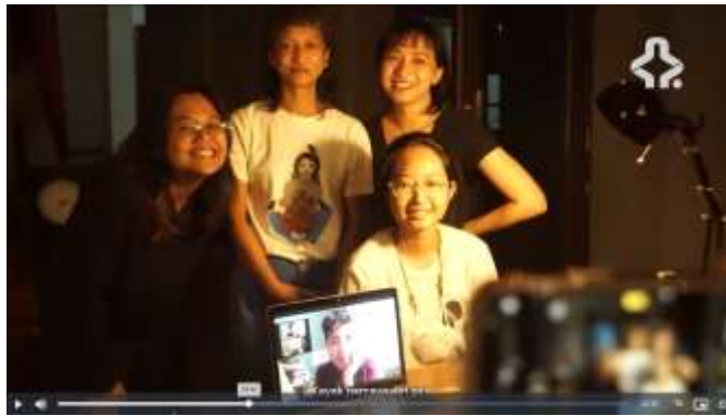
Gambar 3. 8 Part 2 Film MRA

Melalui satu scene, perempuan digambarkan disini memiliki karakter dan kemampuan yang kompeten di bidangnya. Dengan masing masing memegang posisi penting dan tergabung menjadi satu tim untuk mengeksekusi produksi dan mengembalikan kembali narasi Ratna Asmara.