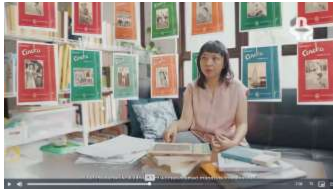
Gambar 3. 9 Part 2 Film MRA (Indonesianatv, 2023) (Sumber: https://indonesiana.tv/search?q=ratna%20asmara , 2023)

Film MRA, dikemas dengan narasi sejarah yang sangat kental. Keseluruhannya merupakan hasil dari perjalanan panjang mengulik kembali narasi Ratna Asmara yang hilang dari sejarah. Kelas Liarsip disini sangat menonjolkan kontribusi mereka dalam mencari kembali Ratna Asmara melalui arsip-arsip yang ditemui melalui koran, majalah, surat kabar, ataupun bentuk fisik lainnya.