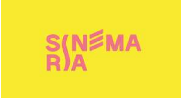
Gambar 2. 7 Profil Komunitas Sinemaria

Keberadaan Sinemaria tidak hanya sekadar memutar film, tetapi juga berfungsi sebagai wadah edukasi yang mengedepankan diskusi komprehensif dan mendalam tentang film, isu yang dibawa atau pengalaman produksi dari pembuatan film itu sendiri. Melalui pendekatan ini, komunitas ini dapat mempertemukan berbagai individu yang tertarik dengan berbagai aspek film, mulai dari produksi hingga apresiasi seni sinema. Mereka juga menitikberatkan pada penghapusan batasan antara penonton dan pembuat film, sehingga kedua belah pihak dapat saling memahami proses kreatif di balik karya-karya yang ditampilkan.