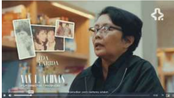
Gambar 3. 12 Part 5 Film MRA