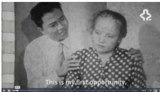
Gambar 3. 5 Part 3 Film MRA

Perempuan dalam dunia sinema memiliki peran yang signifikan, meskipun sejarah mencatat bahwa keterlibatan mereka seringkali termarginalisasi, baik dalam aspek representasi di layar maupun dalam industri perfilman itu sendiri. Kehadiran perempuan sebagai subjek kreatif dan naratif dalam industri film Indonesia mengalami perjalanan yang panjang. Perjalanan ini merefleksikan dedikasi dalam membangun identitas dan suara perempuan di dunia perfilman.