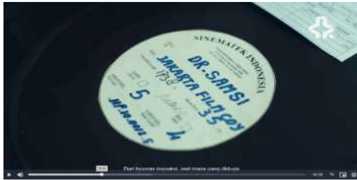
Gambar 3. 10 Part 3 Film MRA (Sumber: https://indonesiana.tv/search?q=ratna%20asmara 2023)

Pada menit 04.23 terlihat reels film Dr. Samsi yang merupakan film yang dibintangi oleh Ratna Asmara. Upaya yang dilakuakn kelas Liarsip hingga mendatangi sinematek tentunya bukan hal yang mudah, hal ini menunjukkan adanya keseriusan mereka dalam membedah kembali nama Ratna Asmara. Proses yang dilakukan dari inspeksi hingga digitalisasi juga memakan waktu yang lama, karena pada tiap prosesnya tidak mudah, bahkan dalam perjalanannya terdapat beberapa reels yang sudah rusak sehingga perlu dilakukan restorasi untuk memperbaiki reels tersebut. Keseriusan ini dilakukan untuk membangkitkan kembali nama Ratna Asmara yang semula hilang dari sejarah perfilman Indonesia.