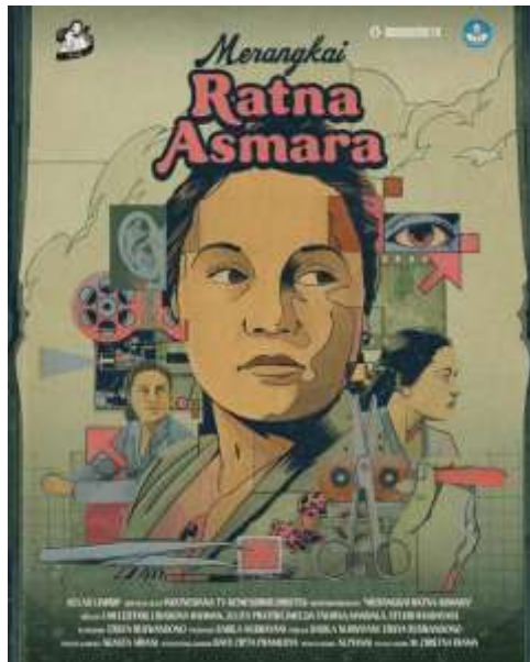
Gambar 2. 1 Poster Film Merangkai Ratna Asmara

Film MRA merupakan sebuah karya sinema yang disutradarai oleh Ersya Ruswandono berupaya merepresentasikan perjalanan hidup Ratna Asmara, salah satu tokoh penting dalam sejarah perfilman Indonesia. Ratna Asmara sebagai salah satu nama yang muncul sebagai sutradara pertama perempuan, memiliki kontribusi besar dalam membentuk perkembangan sinema nasional pada pertengahan abad ke-20. Film MRA tidak hanya bernarasi biografis, tetapi juga sebuah medium untuk menarasikan kembali peran perempuan yang hampir hilang dari sejarah perfilman Indonesia.