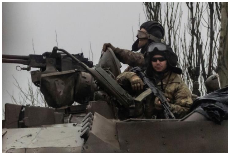
Gambar 2.2 Bantuan Tank dari EU ke Ukraina tahun 2022