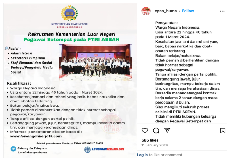
Gambar 2.0 : Akun @cpns_bumn yang mengunggah lowongan pekerjaan yang tidak boleh terafiliasi dengan partai politik di aplikasi Instagram

Akibatnya, orang-orang yang NIK-nya tercatat tanpa persetujuan dalam anggota partai politik, terhalang untuk melamar pekerjaan atau melanjutkan karir di sektor tertentu yang membutuhkan netralitas politik. Seperti salah satu lowongan yang di upload di akun Instagram @cpns_bumn dalam rekrutmen pegawai kementerian luar negeri yang memiliki syarat untuk tidak terafiliasi partai politik. 15