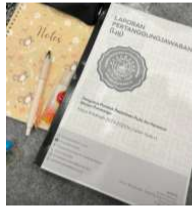
Laporan Keuangan Pengurus