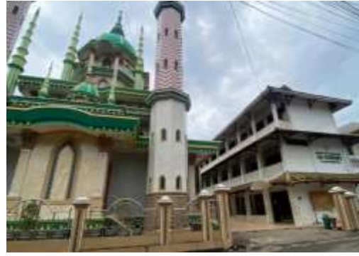
Pondok Pesantren An-Nawawi