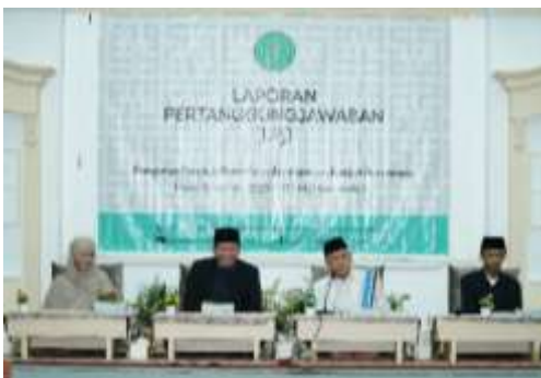
Rapat Pertanggungjawaban Pengurus