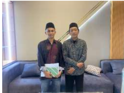
Wawancara dengan Pengurus