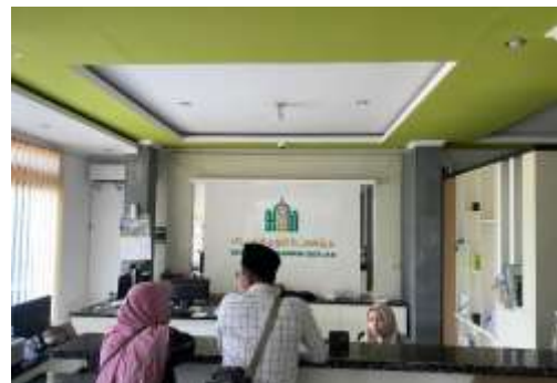
Kantor Yayasan An-Nawawi