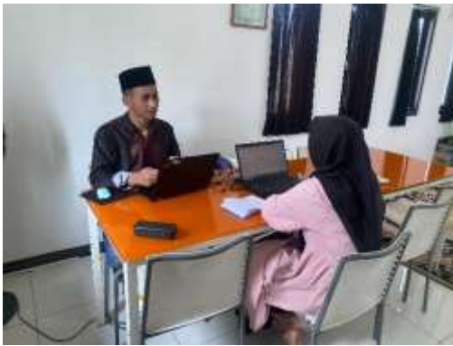
Wawancara dengan Pengurus