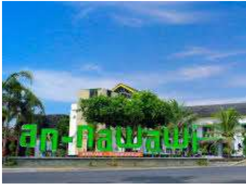
Pondok Pesantren An-Nawawi