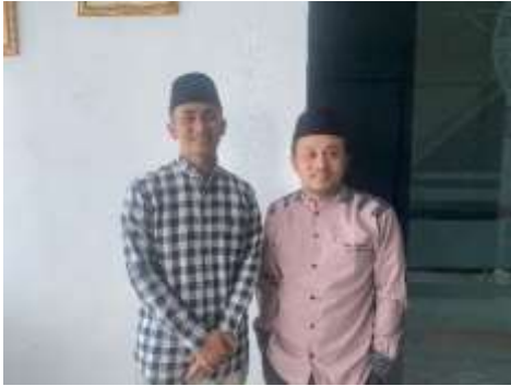
Wawancara dengan Pengurus