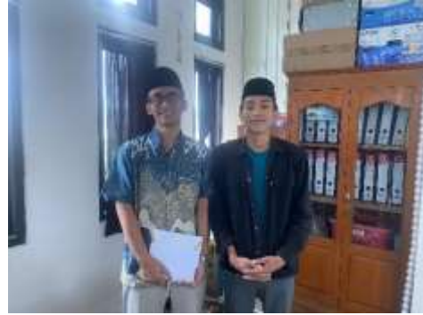
Wawancara dengan Santri