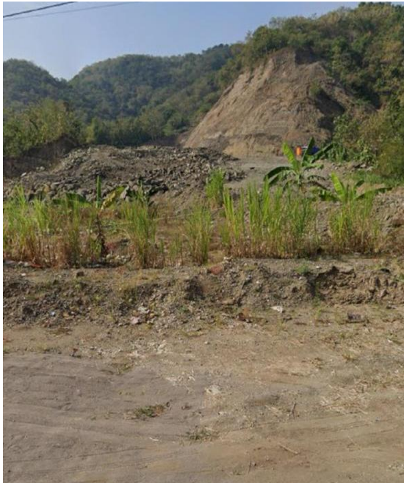
Gambar 1. 4 Tanah kas Kalurahan dengan nomor persil 282 berada di pinggir jalan

Bumi Sejahtera dalam melakukan penambangan di luar wilayah SIPB yang diberikan. Perlu diketahui tanah kas Kalurahan itu berada di pinggir jalan sebagaimana pada gambar 1.4.