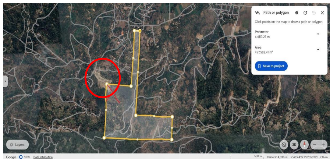
Gambar 1. 3 Citra Satelit PT Pueser Bumi Sejahtera melakukan aktivitas pertambangan diluar SIPB

memiliki SIPB yang mana lokasinya menjorok ke pedalaman dan jauh dari jalan. Akan tetapi berdasarkan pengamatan di lapangan, pertambangan PT Pueser Bumi Sejahtera berada di pinggir jalan. 24 Hal tersebut juga diperkuat dengan pra-penelitian yang dilakukan lokasi pertambangan di Kalurahan Sampang, Kepanewon Gendangsari, Kabupaten Gunungkidul. Hasil pra-penelitian menunjukkan pertambangan berada di pinggir jalan dan berseberangan dengan SD Negeri Kedung Bolong yang ditunjukkan pada gambar 1.3.