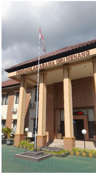
Gedung PA Gir Menang