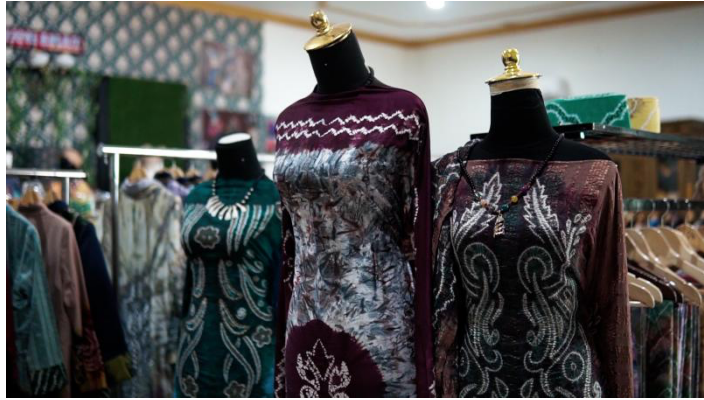
Gambar 2. 6 Koleksi Sasirangan di galeri Diyang Kinjut

Pada tanggal yang sama sekaligus dilakukan pengambilan video proses pembuatan sasirangan yang dilakukan oleh karyawan ibu Hj. Heny. Proses pembuatan dimulai dari penjelujuran dan pencelupan warna untuk menghasilkan kain sasirangan. Pada saat pengambilan video tersebut kain yang dibuat sasirangan hanya berukuran kecil. Hal ini disebabkan karena pada saat penulis datang proses, produksi kain yang berukuran panjang telah selesai dilakukan.