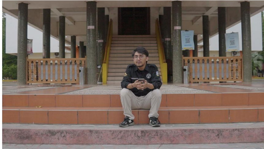
Gambar 2. 16 Penulis menyampaikan hasil kesimpulan