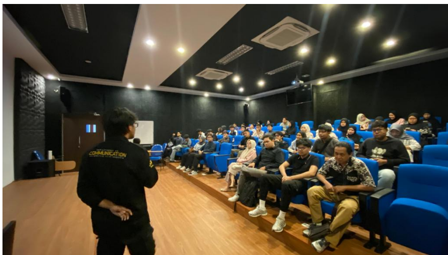
Gambar 2. 18 Penulis Melakukan Presentasi