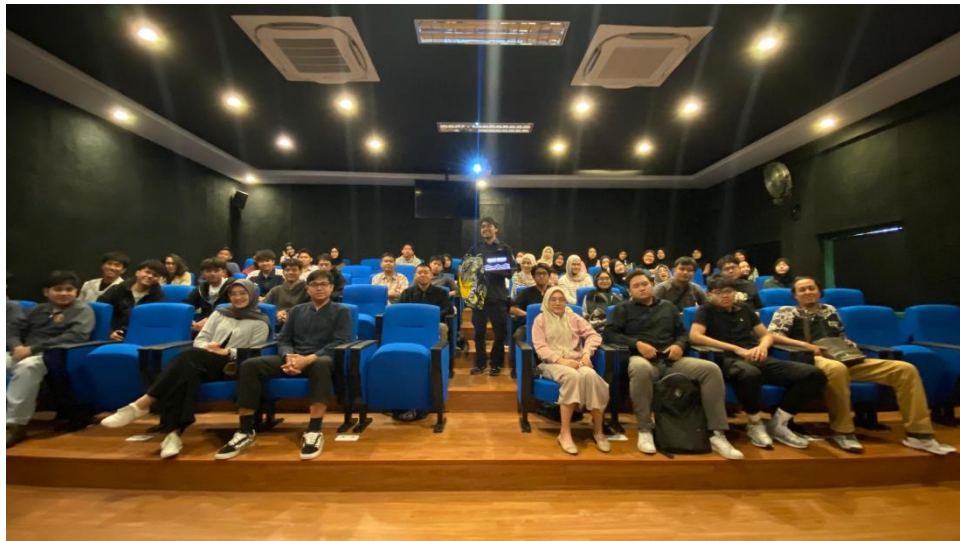
Gambar 2. 22 Foto Bersama Penulis dan Audiens