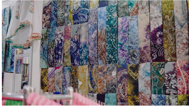
Gambar 2. 12 Koleksi sasirangan milik Toko Sasirangan Galuh