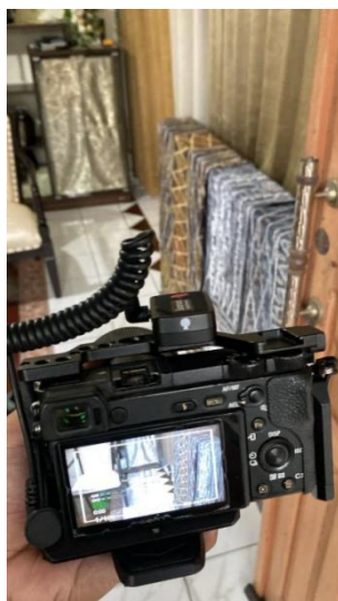
Gambar 2. 1 Persiapan Shooting Narasumber Utama Ibu Lesa Fahriana

Dalam kesempatan itu penulis mengambil footage-footage koleksi kain sasirangan yang ibu Lesa miliki untuk menunjukkan motif-motif sasirangan tradisional dengan filosofi maknanya. Dengan banyaknya koleksi sasirangan tradisional yang dimiliki oleh ibu Lesa memudahkan penulis untuk pengambilan gambar. Dengan persetujuan Ibu Lesa maka pada saat wawancara, koleksi sasirangan beliau disusun menjadi latar.