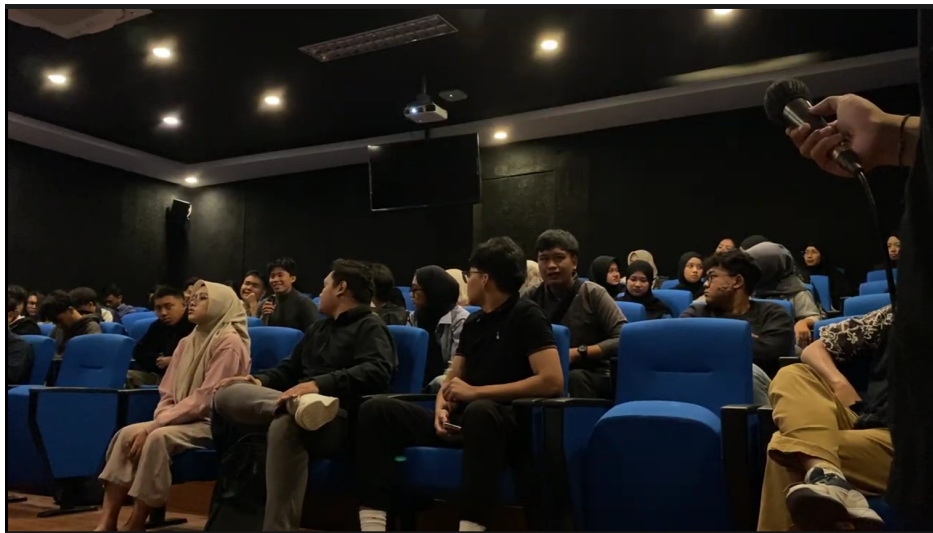
Gambar 2. 20 Sesi Tanya Jawab dengan Audiens