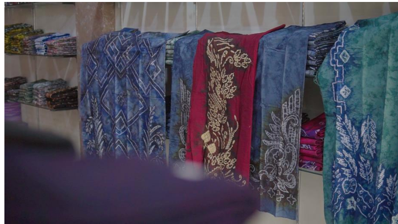
Gambar 2. 13 Koleksi sasirangan milik Toko Sasirangan Pancar

Pada acara Hari Jadi Kota Banjarbaru penulis mengambil gambar orang-orang yang menggunakan baju sasirangan. Di acara tersebut para undangan diwajibkan memakai sasirangan. Beraneka ragam motif sasirangan dapat dilihat. Sebagian besar mereka memakai sasirangan bordir yang menjadi khas Kota Banjarbaru. Dengan penambahan detail bordir pada motif sasirangan membuat motif menjadi lebih tajam lagi, namun harga sasirangan ini lebih mahal dari sasirangan tradisional tanpa bordir.