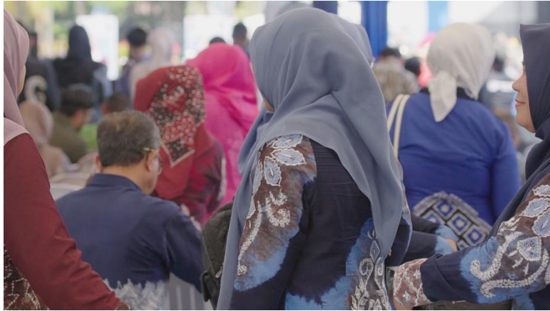
Gambar 2. 14 Sasirangan tradisional dengan motif yang dibordir