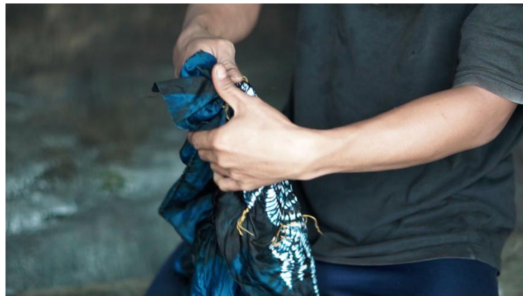
Gambar 2. 9 Proses pembukaan jelujur benang setelah selesai pewarnaan

Proses penjelujuran kain untuk membuat motif memerlukan waktu yang cukup lama karena penjelujuran harus dilakukan menggunakan tangan tidak dapat menggunakan mesin. Setelah dijelujur benang ditarik dengan kuat agar motif benar-benar terbentuk dan pada saat pewarnaan tidak tercampur. Apabila tarikan benang tidak kuat maka pada saat proses pewarnaan, warna dapat masuk ke motif yang dibuat sehingga tidak akan terbentuk motif sesuai yang dikehendak atau motif menjadi tidak sempurna.