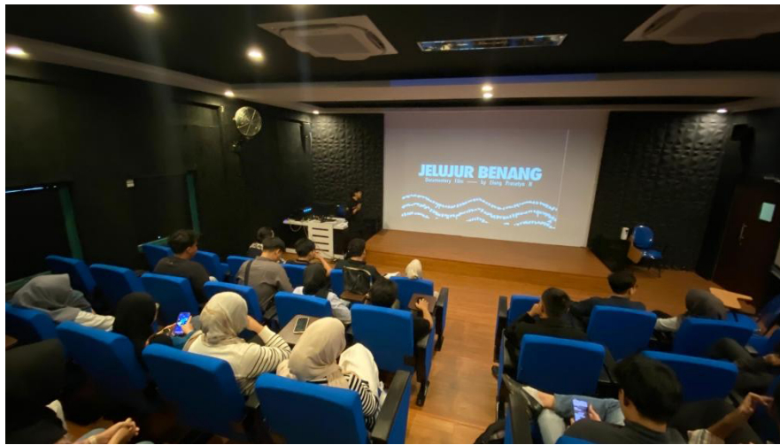
Gambar 2. 17 Penayangan Film Dokumenter "Jelujur Benang"