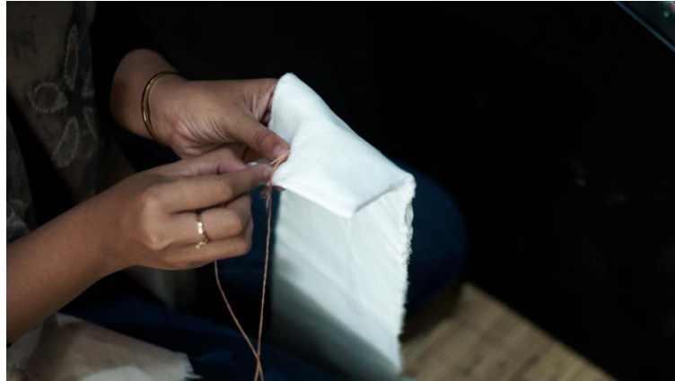
Gambar 2. 8 Proses penjahitan atau penjelujuran kain untuk membuat motif sasirangan

Proses penjelujuran kain untuk membuat motif memerlukan waktu yang cukup lama karena penjelujuran harus dilakukan menggunakan tangan tidak dapat menggunakan mesin. Setelah dijelujur benang ditarik dengan kuat agar motif benar-benar terbentuk dan pada saat pewarnaan tidak tercampur. Apabila tarikan benang tidak kuat maka pada saat proses pewarnaan, warna dapat masuk ke motif yang dibuat sehingga tidak akan terbentuk motif sesuai yang dikehendak atau motif menjadi tidak sempurna.