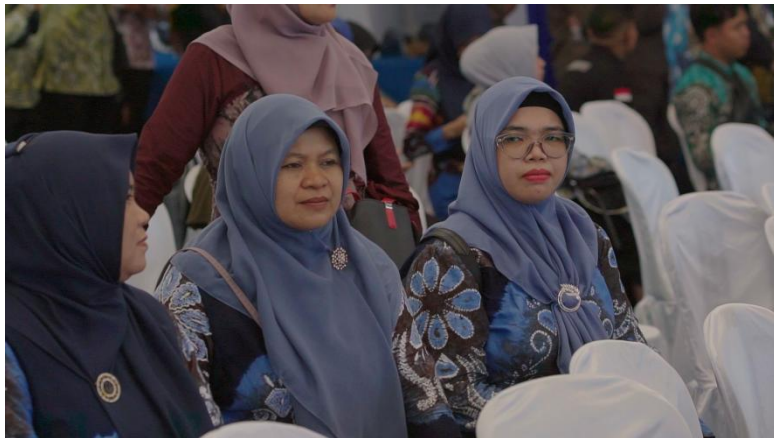
Gambar 2. 15 Perpaduan sasirangan bordir dan tanpa border

Pada tahapan produksi ini, penulis juga melakukan pengambilan video dimana penulis menyampaikan kesimpulan yang didapatkannya berdasarkan dari wawancara. Lokasi pengambilan video di museum Lambung Mangkurat yang beralamat di jalan Ahmad Yani KM. 35,5 Kecamatan Banjarbaru Utara. Penulis mengambil latar belakang bangunan gedung museum yang menyerupai rumah Bumbungan Tinggi pada saat pengambilan video.