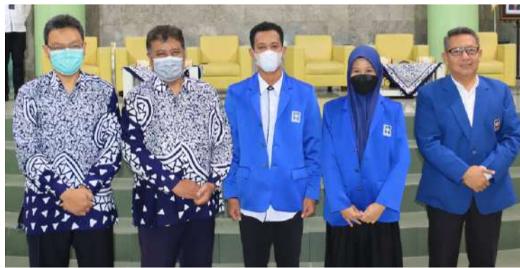
Rektor UII (paling kanan) melepas mahasiswa KKN angkatan 65 tahun akademik 2022/2023.

"Jika KKN dijalankan dengan niat tulus, dilakukan sepenuh hati, insyaAllah