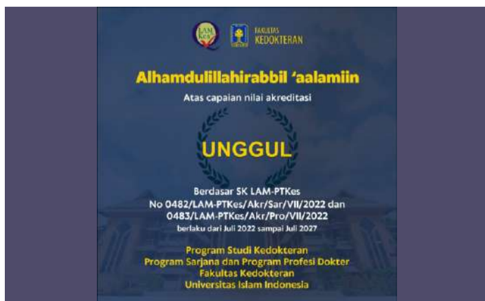
Kedokteran raih unggul dalam reakreditasi.