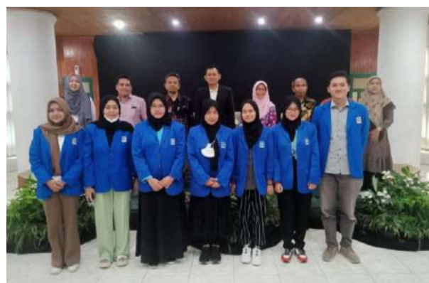
Mahasiswa peraih beasiswa IISMA 2021 dan 2022 bersama pimpinan.