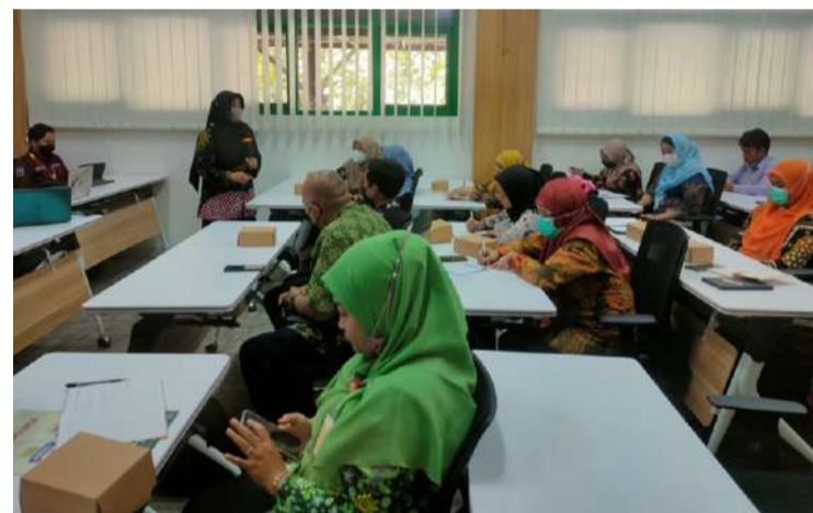
Suasana workshop MGBK Guru SMA se-DIY di FPSB UII.

"Kita dan mereka adalah makhluk merdeka dan berdaya untuk memilih emosi dan respon diri kita sendiri. Buat mereka terikat secara emosi dan perilaku ( emotional & behavioral engaged ). Emosi itu menular, tularkan yang baik. Kaitkan materi dan values kehidupan, sehingga siswa merasa relate,