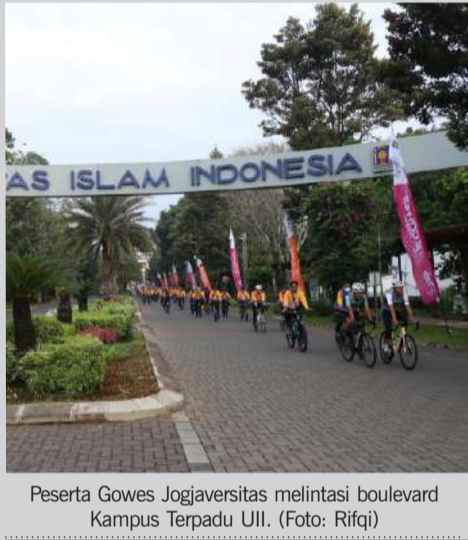
Peserta Gowes Jogjaversitas melintasi boulevard Kampus Terpadu UII.