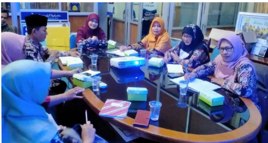
Pelatihan Kepala Madrasah Ibtidaiyah di Kantor LAZIS Unisia.