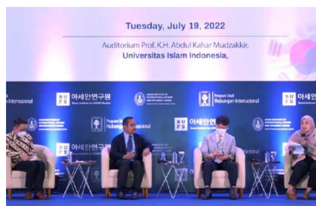
Suasana IR UII in Conversation: ASEAN-Korea Relations (Progress and Opportunities) Prodi HI FPSB UII.

Hangga menambahkan bahwa ASEAN dan Korea dapat bekerjasama untuk menjaga stabilitas regional atau bahkan bisa untuk wilayah yang lebih luas lagi. (Widodo)