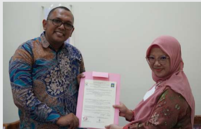
Serah terima MoU antara FIAI dengan Universitas Malikussaleh Aceh.

“UII didirikan oleh orang-orang berlatarbelakang sosial keagamaan, UII tidak bersosial keagamaan atau kemasyarakatan tertentu. Tujuan dari pendirian UII adalah untuk mencetak cendekiawan dan pemimpin masa depan. Islam rahmatan lil alamin sebagai perilaku, Islam uilil albab sebagai kapasitas intelektual dan Internalisasi nilai-nilai Islam dalam keilmuan dan kehidupan,” jelasnya.