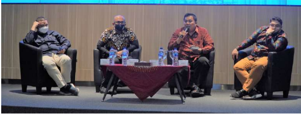
Para Pemateri dan Moderator saat sesi penyampaian materi.

KALIURANG (UUI News) – Program Studi Ekonomi Islam (PSEI) Jurusan Studi Islam (JSI) Fakultas Ilmu Agama Islam (FIAI) Universitas Islam Indonesia (UII) selenggarakan Kuliah Umum bertema “Digitalisasi Ekonomi dan Keuangan Syariah Pasca Pandemi”, pada Rabu, 14 Dzulhijjah 1443 H/13 Juli 2022 di Ruang Auditorium lantai 4 Fakultas Hukum (FH) UII.