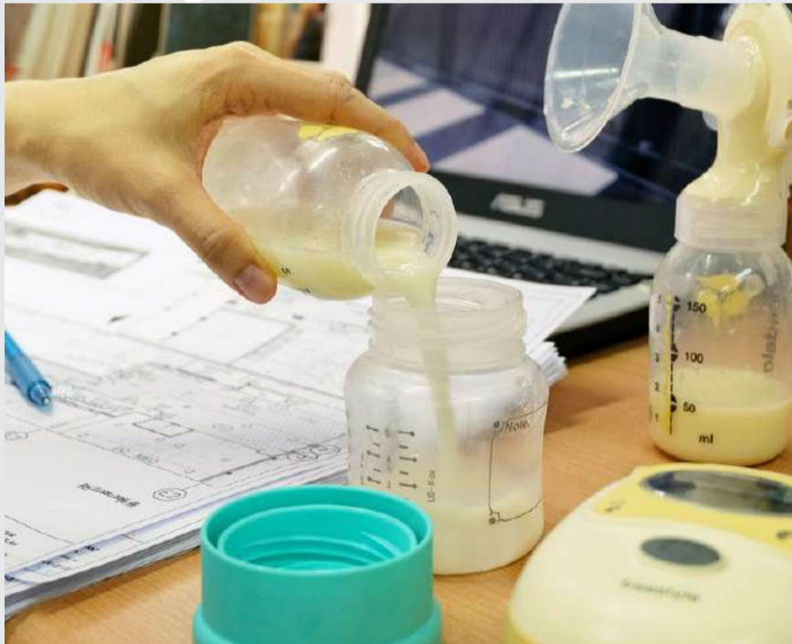
Kesehatan ASI Ibu Bekerja.

Apa yang perlu dipersiapkan oleh ibu bekerja? Pada masa cuti, tentunya menyusui secara langsung akan lebih diutamakan daripada memberikan ASI perah. Pada proses menyusui secara langsung, kontak antara kulit ibu dan bayi, komunikasi verbal dan non verbal ibu pada bayi, penyamaan suhu tubuh, dan juga pelukan hangat ibu pada bayi akan memberikan banyak manfaat pada ikatan cinta antara ibu dan bayi. Hal ini tidak akan tergantikan. Selama masa cuti, ibu bisa mulai memerah ASI pada saat ibu merasa produksi ASI mulai banyak. Waktunya bisa