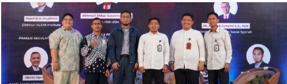
Para Panelis seminar internasional di ajang TEMILNAS FoSSEI XXI 2022.

KALIURANG (UUI News) – Alhamdulillah, Forum Kajian Ekonomi Islam (FKEI) Program Studi Ekonomi Islam (PSEI) Fakultas Ilmu Agama Islam (FIAI) Universitas Islam Indonesia (UII) sukses selenggarakan Temu Ilmiah Nasional (TEMILNAS) FoSSEI XXI 2022 dengan tema “Penguatan Ekosistem Lembaga Keuangan Syariah dalam Implementasi Keuangan Berkelanjutan guna Pemulihan Ekonomi Nasional”, dilaksanakan pada 2-6 Dzulhijjah 1443H/1-5 Juli 2022.