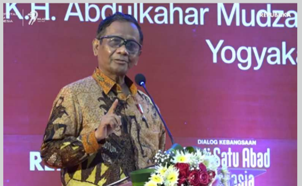
Tangkapan Layar Menteri Koordinator Politik, Hukum, dan Keamanan (Menko Polhukam), Prof. Moh. Mahfud MD pada 'Dialog Kebangsaan: Imaji Satu Abad Indonesia'.