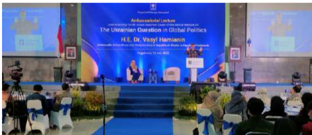
Suasana Ambassadorial Lecture Prodi HI FPSB UII bersama Dubes Ukraina untuk Indonesia.

K ALIURANG (UII News) - Saat ini tidak ada jalan keluar dari perdamaian antara Rusia dan Ukraina kecuali mereka (baca: Rusia) meninggalkan Ukraina atau mereka akan mati di Ukraina. Rusia tidak akan bisa mengalahkan Ukraina dengan cara apapun. Bahkan Rusia akan mengalami kekalahan jika NATO ambil bagian dalam konflik yang terjadi.