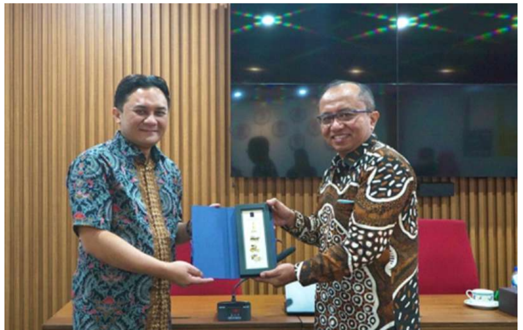
Dekan FBE UII (kanan) menyampaikan kenang-kenangan kepada delegasi Telkom University

CONDONG CATUR (UII News) – Program Studi Akuntansi Telkom University mengunjungi Fakultas Bisnis dan Ekonomika (FBE) Universitas Islam Indonesia (UII) pada Rabu 5 Muharram 1444 H/3 Agustus 2022 di Ruang Sidang 1/1 Gedung Prof. Dr. Ace Partadiredja FBE UII.