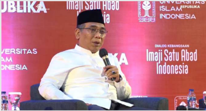
KH. Yahya Cholil Staquf (Gus Yahya) saat menjadi salah satu pembicara dalam acara "Dialog Kebangsaan: Imaji Satu Abad Indonesia".

K ALIURANG (UII News) - Kemerdekaan Indonesia diperjuangkan dengan sebuah visi yang universal yaitu Kemerdekaan sebagai hak sebuah bangsa. Hal ini bukan hanya klaim keindonesiaan saja tetapi juga menjadi momentum kemerdekaan untuk segala bangsa di dunia. Selain itu Proklamasi Kemerdekaan Indonesia memberikan mandat untuk memperjuangkan peradaban yang lebih mulia bagi seluruh umat manusia.