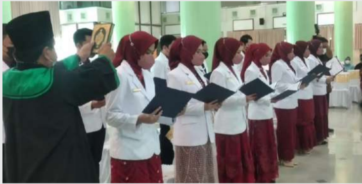
Segenap dokter baru periode 57 sedang membaca sumpah.

Menurut Rektor UII bahwa ada satu cara dalam menghadapi ketidakpastian tersebut yaitu dengan menjadi pribadi yang bisa beradaptasi dengan segala perubahan. Karena apa yang kita pelajari hari ini, bisa jadi sudah kedaluwarsa di masa akan datang.