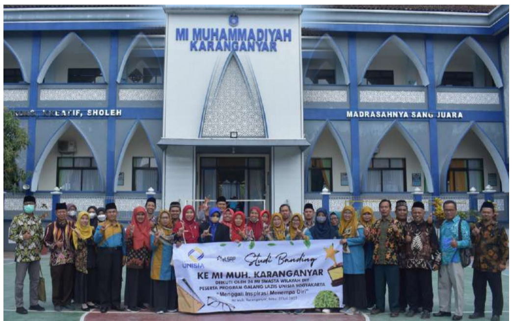
Sebanyak 24 Kepala Madrasah mengikuti kegiatan studi banding di MI Muhammadiyah Karanganyar.

K ARANGANYAR (UUI News) - Sebanyak 24 Kepala Madrasah yang tergabung dalam Program Galang Madrasah, Lembaga Amil Zakat Infaq dan Shadaqah (LAZIS) Unisia mengikuti kegiatan studi banding ke Madrasah Ibtidaiyah (MI) Muhammadiyah Karanganyar Jawa Tengah, pada Kamis, 28 Dzulhijjah 1443 H/ 28 Juli 2022.