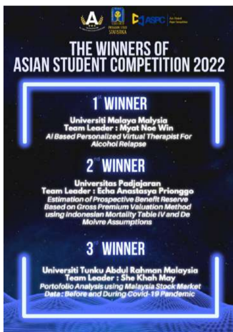
Pemenang Statistika Enthusiastic: Asia Student Paper Competition 2022 .

Lebih lanjut Muhajir menjelaskan bahwa kompetisi dilatarbelakangi adanya perkembangan jenis data yang sangat beragam, serta ledakan kuantitas data yang dapat menaikkan ukuran data secara