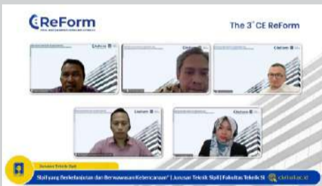
Para pemateri saat memaparkan materinya.

K ALIURANG (UII News) - Guna mewadahi diseminasi hasil penelitian bidang teknik sipil, kebencanaan dan keilmuan yang terkait, bagi dosen dan mahasiswa dari internal maupun eksternal, Jurusan Teknik Sipil (JTS) Fakultas Teknik Sipil dan Perencanaan (FTSP) Universitas Islam Indonesia (UII) kembali menggelar Civil Engineering Research Forum (The 3rd CE ReForm) secara daring, pada 21 Dzulhijjah 1443 H/20 Juli 2022.