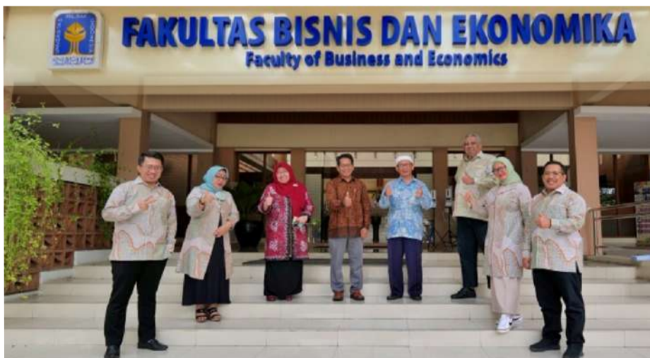
Sesi foto bersama delegasi Usakti bersama jajaran pimpinan FBE UII