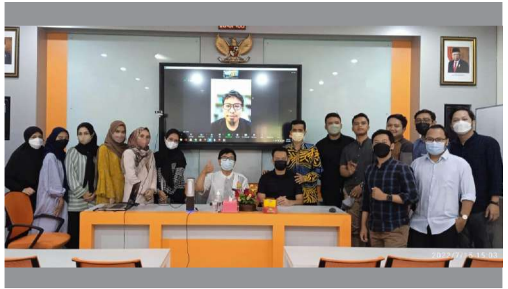
Para alumni FK UII saat memberikan motivasi kepada calon dokter FK UII.

K ALIURANG (UUI News) – Dalam rangka menguatkan motivasi dan membangun inspirasi, Ikatan Keluarga Alumni (IKA) Fakultas Kedokteran (FK) Universitas Islam Indonesia (UII) menyelenggarakan temu alumni untuk membekali para calon dokter baru dalam menghadapi dunia nyata dan dunia kerja dalam menjalankan amanah profesi sebagai dokter.