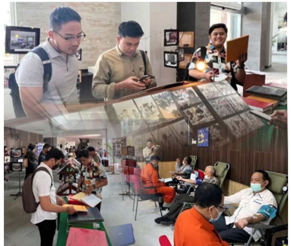
Berbagai kegiatan dalam kegiatan Pustadok LKBH FH UII 2022.