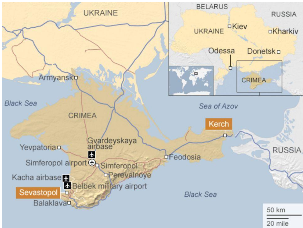
Gambar 1 Peta Krimea